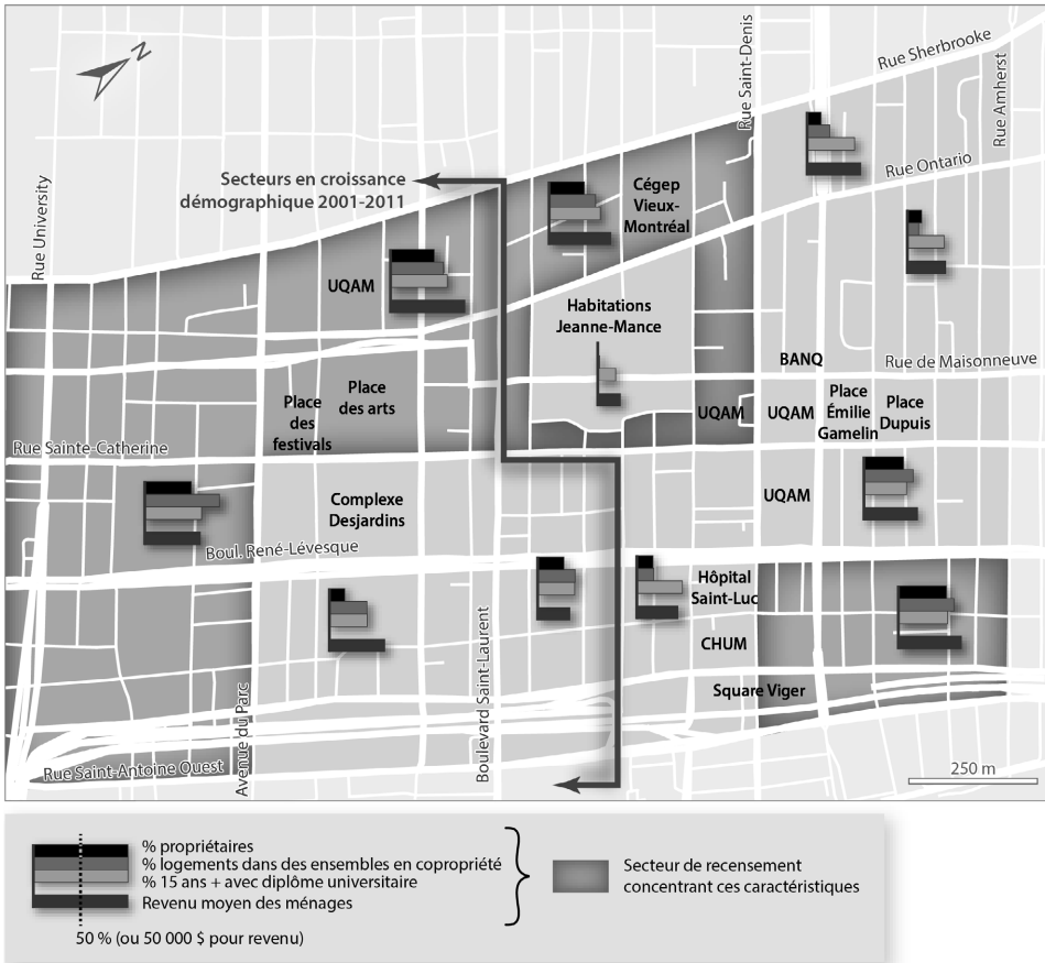
Figure 2 Quelques caractéristiques de la population

Sources des données brutes: Ville de Montréal, base de données cartographiques; Statistique Canada, Recensements de 2001 et 2011 Cartographie: Hélène Bélanger