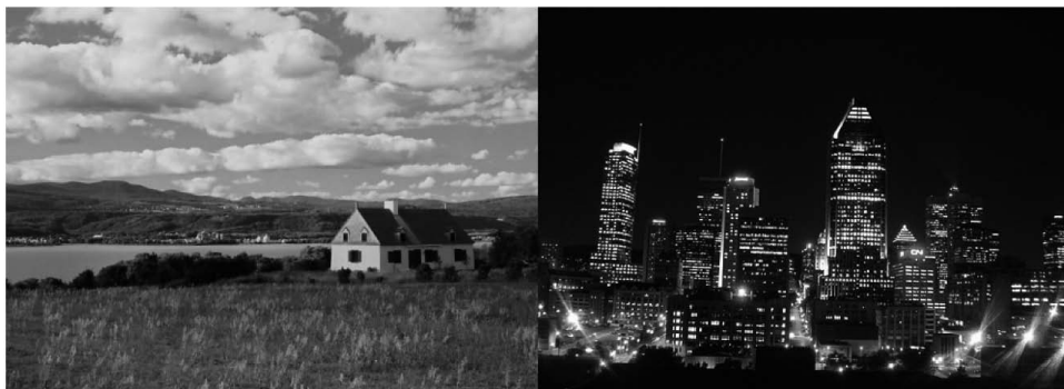
Figure 3 Représentations habituelles de la campagne et de la ville

Source : 1 ère image : http://forum.reasonfrance.fr/hadopi-les-independants-melent-enfin-t6219-140.html 2 e image : http://www.meteomontreal.net/Location-Voiture-Montreal.html