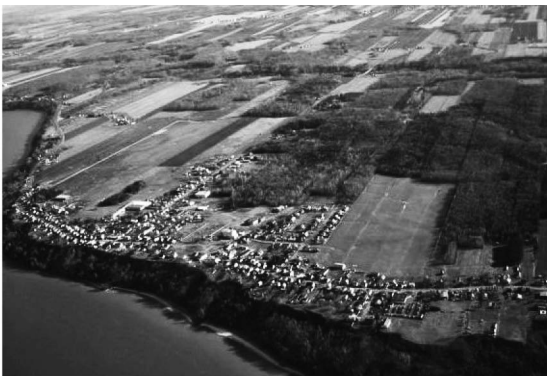
Figure 4 Un village québécois (Deschailions-sur-Saint-Laurent)

Analysons la question en considérant, à partir de l'exemple québécois, le problème spécifique de la campagne. Comme mentionné, la LPTAA institue une zone agricole afin de préserver un territoire cultivé ou cultivable et les activités liées à sa mise en culture. De prime abord, l'institution d'une zone réservée à l'agriculture sied à une vision impressionnante d'une campagne distincte de la ville. Le tableau, pour deux raisons, doit toutefois être nuancé. La première raison, déjà évoquée, est que la LPTAA prévoit d'autoriser à la campagne, si la pratique de l'agriculture n'en est pas menacée, des usages non agricoles, notamment des usages résidentiels. Ces usages sont localisés à la faveur d'îlots déstructurés ou de lots dont la superficie est suffisante pour ne pas nuire à l'agriculture. Il en résulte une urbanisation diffuse. La seconde est que ladite zone agricole coexiste avec des milieux d'habitat concentré, le plus souvent des villages qui, eux, bien qu'exclus de la zone agricole, ne participent pas moins à l'image qu'on se fait de la campagne (figure 4). Or ces milieux, tout campagnards soient-ils, ont, au regard même de la LAU, un caractère urbain. Au même titre que ceux qui constituent