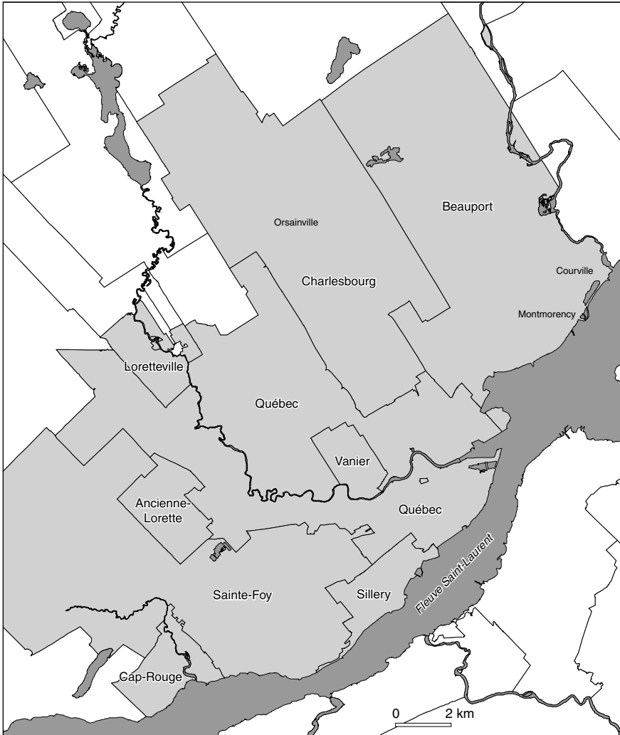
Figure 1 Territoire à l'étude