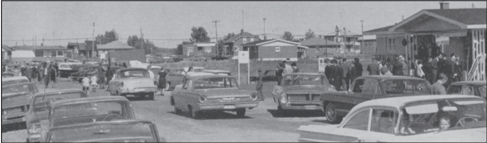
Figure 3 La « parade » des Bois-Francis, 1964