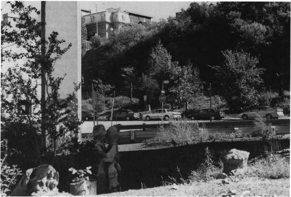
Photo 1 L'îlot Fleury sous l'autoroute en viaduc