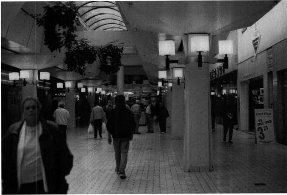
Photo 4 Le Mail Centre-ville