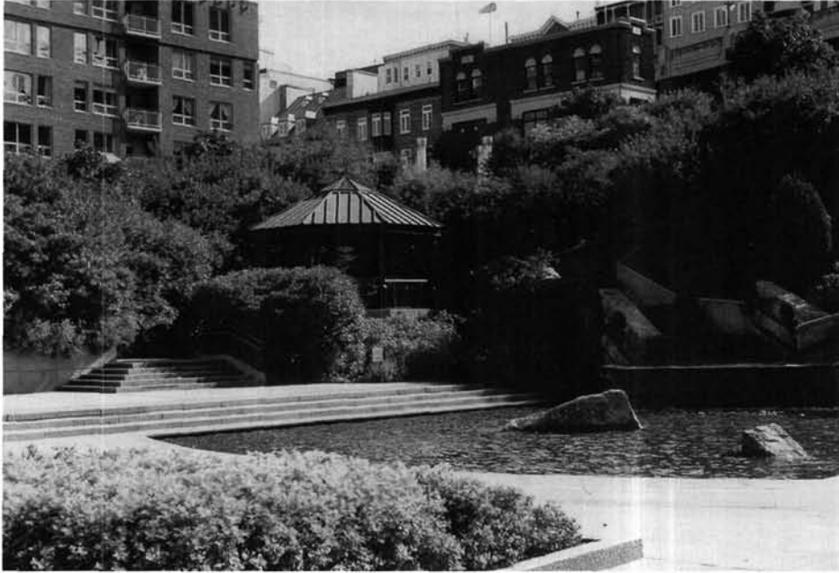
Photo 2 Le jardin Saint-Roch

Le complexe Méduse est un troisième exemple de projet de développement lié à la revitalisation de Saint-Roch. Il s'agit d'un complexe axé sur les arts qui regroupe des coopératives de production, des ateliers d'artistes, des salles de spectacles et de conférences, de même qu'un poste de radio communautaire et un restaurant (photo 3). Cet équipement est le résultat d'un partenariat entre plusieurs organismes. Il a été réalisé en 1995 grâce à la participation financière de la Ville de Québec, du Ministère des Affaires culturelles du Québec, du gouvernement fédéral et de la caisse d'économie des travailleurs du Québec. Méduse s'insère dans une stratégie de développement du quartier selon la thématique des arts et de la culture. Situé sur la côte d'Abraham, Méduse tente de créer un lien entre le quartier Saint-Roch et le quartier Saint-Jean-Baptiste, ce dernier étant situé en haute-ville. Ce complexe constitue également un effort significatif de restauration et d'intégration architecturale de bâtiments dans un tissu urbain ancien.