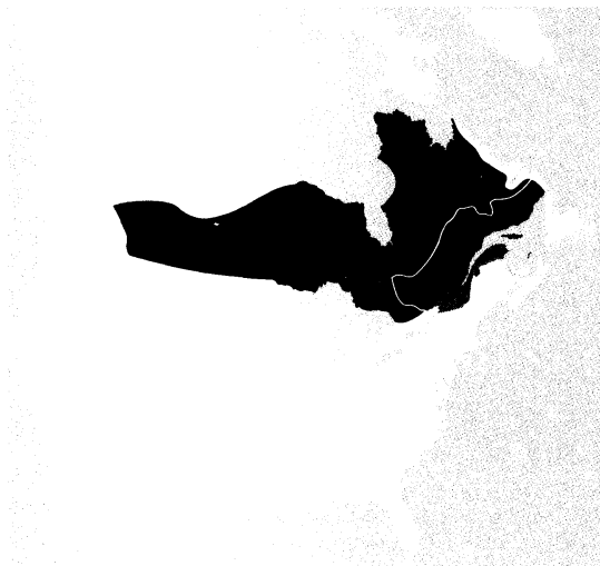
Visions de Labelle et de Buies, 1889