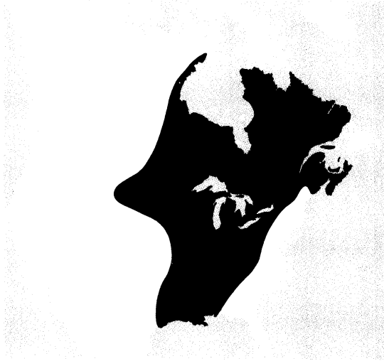
L'Amérique française avant le traité d'Utrecht, 1713