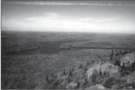
Figure 2 Le lac Stukely et ...