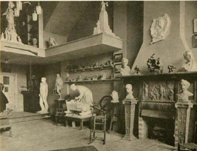
fig. 3. Albert Dumas, «Un coin du merveilleux atelier», La Revue moderne , 15 mars 1920, p. 11.

peintures est cependant secondaire par rapport au rôle central que joue l'atelier, lieu pour la création des sculptures destinées à l'espace public et qui doivent être réalisées à l'échelle avant d'être envoyées chez le fondeur (fig. 5).