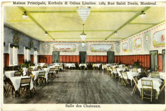
La Salle des Châteaux du Restaurant Kerhulu & Odiau. Montréal, Novelty Mfg & Art Co, [192?] Carte postale.