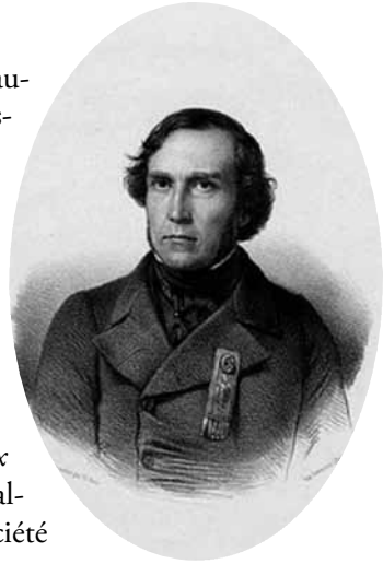
Gustave de Beaumont (1802-1866)