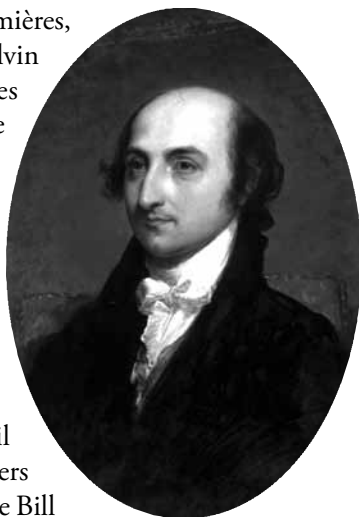
Albert Gallatin (1761-1849)

Après la fin de son mandat à l'exécutif, Gallatin a poursuivi sa carrière à titre de diplomate, négociant entre autres, avec l'Angleterre, les traités de Gand qui mettait fin à la guerre en 1814 et celui de 1818 renouant une alliance de commerce et fixant la frontière entre les États-Unis et le Canada à l'ouest, ultérieurement, il rédige un rapport sur celle du Maine et du Nouveau-Brunswick.