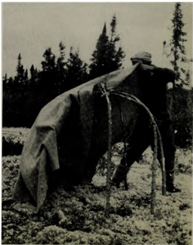
Dans le centre de l'Ungava, Coomis prépare la tente de la suerie. Quelques perches arquées, plantées dans le sol moussu, et une couverture de laine pour retenir la vapeur.