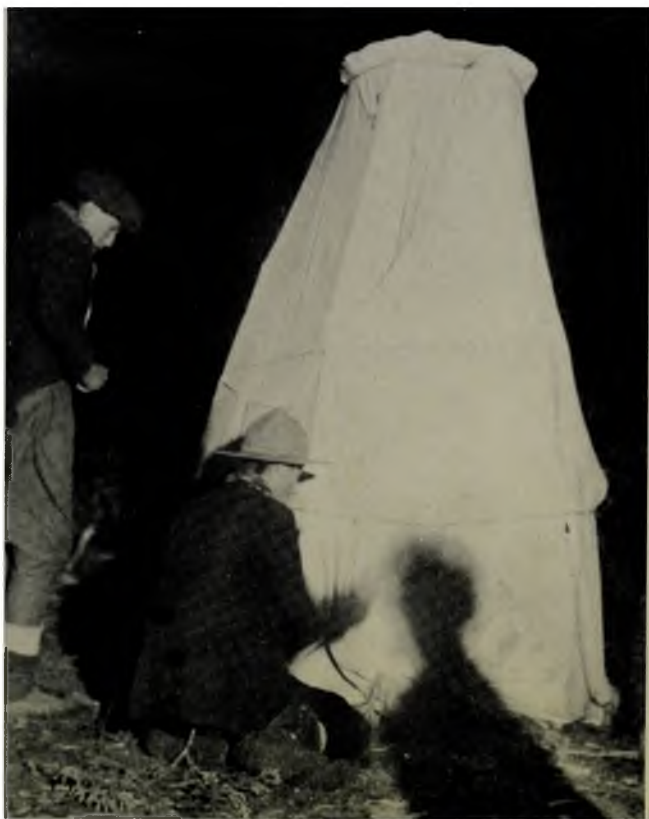
Les assistants fixent au sol la paroi de la tente où vient de pénétrer le jongleur. Les esprits entreront bientôt dans la danse, et la tente tremblera violemment. Lac Mistassini 1946.