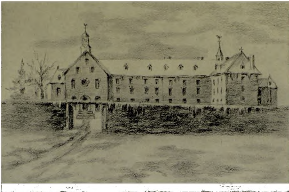
Maison de Charité des Frères Charon au temps du Frère Chrestien Turcq.