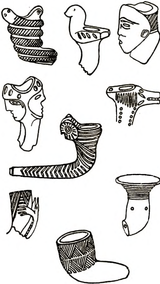
Dessins de l'auteur d'après des gravures du livre de Harlan I. Smith "An Album of Prehistoric Canadian Art".