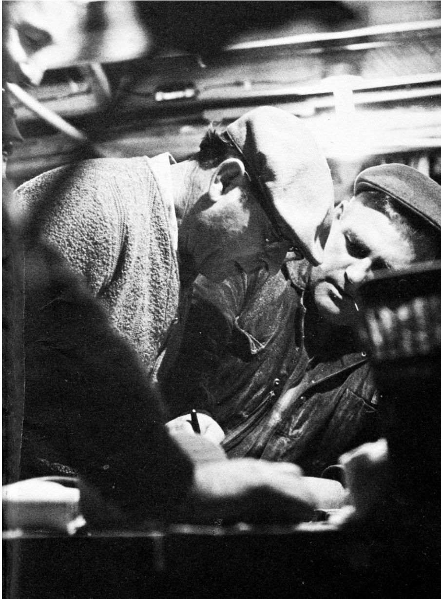
Discussion sur la courbure d'une pièce de bois faite sur mesure pour assurer la direction de la goélette : « pas assez de tonture », se disent les experts avant d'en corriger la forme. Ce documentaire de Pierre Perrault montre comment se manifeste l'expertise : par l'observation, le toucher, mais aussi en soupesant la pièce de bois. Extrait du film Les voitures d'eau , de Pierre Perrault. Production et distribution de l'Office national du film du Canada.