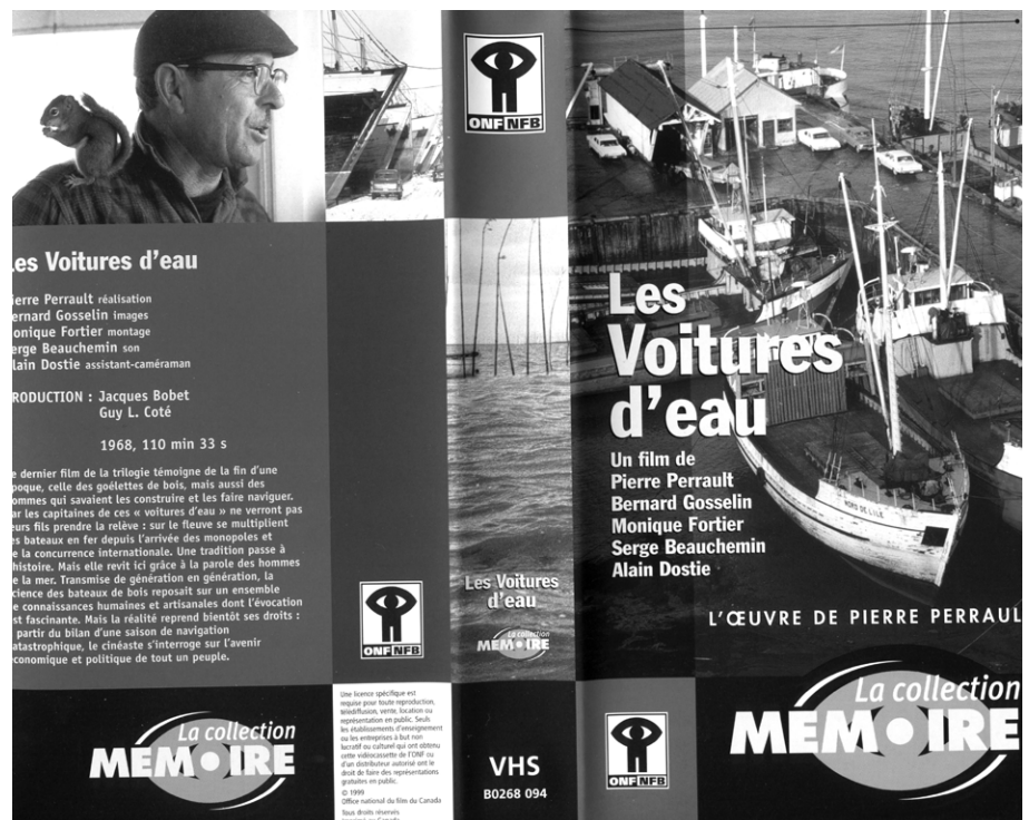
Jaquette de la vidéocassette du film Les voitures d'eau , de Pierre Perrault (réédition de 1999). Production et distribution de l'Office national du film du Canada. Après avoir été distribués en 16 mm et avant leur commercialisation en DVD, les films de Pierre Perrault ont été repris en format VHS, individuellement et en coffrets, dans la collection « Mémoire ». (Reproduit avec l'autorisation de l'Office national du film du Canada).

Sorti au début de 1969 après quasiment trois années de tournage, Les voitures d'eau de Pierre Perrault (1927-1999) demeure le film le moins connu de sa fameuse « trilogie de l'Île-aux-Coudres » qui débutait avec Pour la suite du monde (1963) et se poursuivait avec Le règne du jour (1966). Et pourtant, un demi-siècle après sa sortie et vingt ans après la disparition du cinéaste, on constate qu'à lui seul, ce dernier titre de la trilogie encapsulait une partie de la mémoire de la construction des goélettes de bois sur l'île aux Coudres en montrant un passé désormais révolu. De plus, Les voitures d'eau témoigne dramatiquement de la fin d'une époque : la disparition annoncée d'une forme de navigation fluviale, mais aussi d'un savoir-faire lié au travail du bois selon des procédés qui s'étaient transmis de génération en génération. Des dimensions historiques, ethnologiques, culturelles, patrimoniales et politiques y sont également présentes. Et comme l'écrit notre meilleur historien du cinéma québécois – le professeur Yves Lever – sur son site Internet, le film Les voitures d'eau reste indissociable du contexte de la Révolution tranquille, car certains des dialogues abordent en filigrane des thèmes comme la moder-