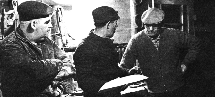
La conception de la goélette résulte de plusieurs séries d'essais et d'erreurs, avant de déterminer le juste milieu : un savant équilibre entre tradition et intuition. Entre 1966 et 1968, l'équipe de Pierre Perrault a filmé pour une dernière fois sur l'île aux Coudres une tradition artisanale de construction navale qui ne s'est pas transmise à la génération suivante. Extrait du film Les voitures d'eau , de Pierre Perrault. Production et distribution de l'Office national du film du Canada. (Reproduit avec l'autorisation de l'Office national du film du Canada).

intégrante d'une identité partagée : « Nous autres icitte à l'île aux Coudres, on est nés sur un canot ». Mais comme le montre le film, cette insularité allait provoquer l'isolement politique de cette communauté mal représentée et mal défendue par le gouvernement fédéral de l'époque. Se sentant dépassés par une concurrence déloyale et souvent étrangère, ces navigateurs voient des bateaux de fer venus de l'étranger exécuter leur travail plus vite et à moindre coût. Le plaidoyer du capitaine Joachim Harvey dénonce la mainmise des compagnies comme la Consolidated-Bathurst qui accaparent à la fois une grande partie des droits forestiers, des ressources forestières et des exportations, avec l'approbation des autorités fédérales en place. Face à ces stratégies d'intégration verticale, les revendications des cabotiers étaient pourtant claires :