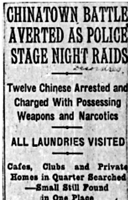
Cet article mentionne une descente systématique dans le quartier à la recherche d'éléments liés aux narcotiques, mais également à d'autres vices. «Chinatown Battle Averted as Police Stage Night Raids», The Montreal Gazette , 1934, 22 janvier 1934, p. 10. (Archives de Montréal).

L'année 1949 sonne le déclin des fumeries d'opium sino-montréalaises. Le gouvernement chinois, en mettant en place des réglementations qui visent à rendre progressivement l'opium et sa production illégales, limite grandement l'approvisionnement par les canaux d'échanges chinois. Les arrestations des consommateurs de narcotiques sino-montréalais relatées dans les médias ont trait à d'autres drogues, notamment l'opioïde qu'est l'héroïne. Bien que toujours liée à la consommation d'opium dans la mémoire et les représentations, une distanciation se produit entre la communauté sino-montréalaise et cette drogue. Avec les projets de renouvellement urbains du quartier chinois qui débutent dans les années 1960, l'opium est presque dissocié des Sino-Montréalais alors que leur