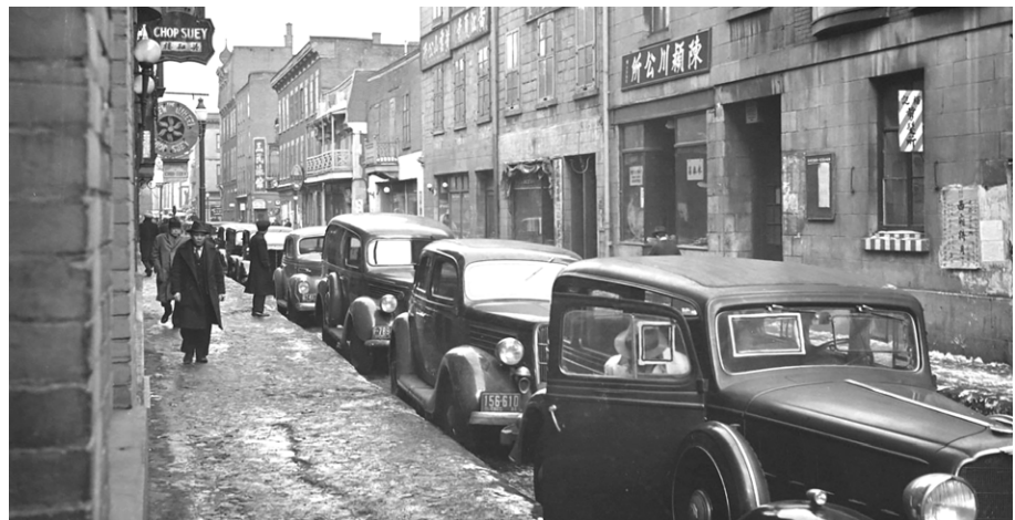
Photo d'une rue du quartier chinois montrant des commerces sino-montréalais et des voitures garées. 29 février 1940.

Cette perception d'une consommation uniquement sino-montréalaise de l'opium fait tout de même abstraction d'une autre dimension du phénomène. En effet, non seulement les Sino-Montréalais n'étaient-ils pas tous des consommateurs d'opium, mais une partie des usagers des fumeries d'opium du quartier chinois étaient des Canadiens d'ascendance européenne, comme en témoignent les journaux et les rapports d'arrestations des services policiers. Qualifié en Occident de « drogue des poètes », l'opium était notamment consommé par des écrivains et des artistes qui lui attribuaient des effets bénéfiques. Cette drogue, opinaient-ils, stimulaient leur créativité. Elle était