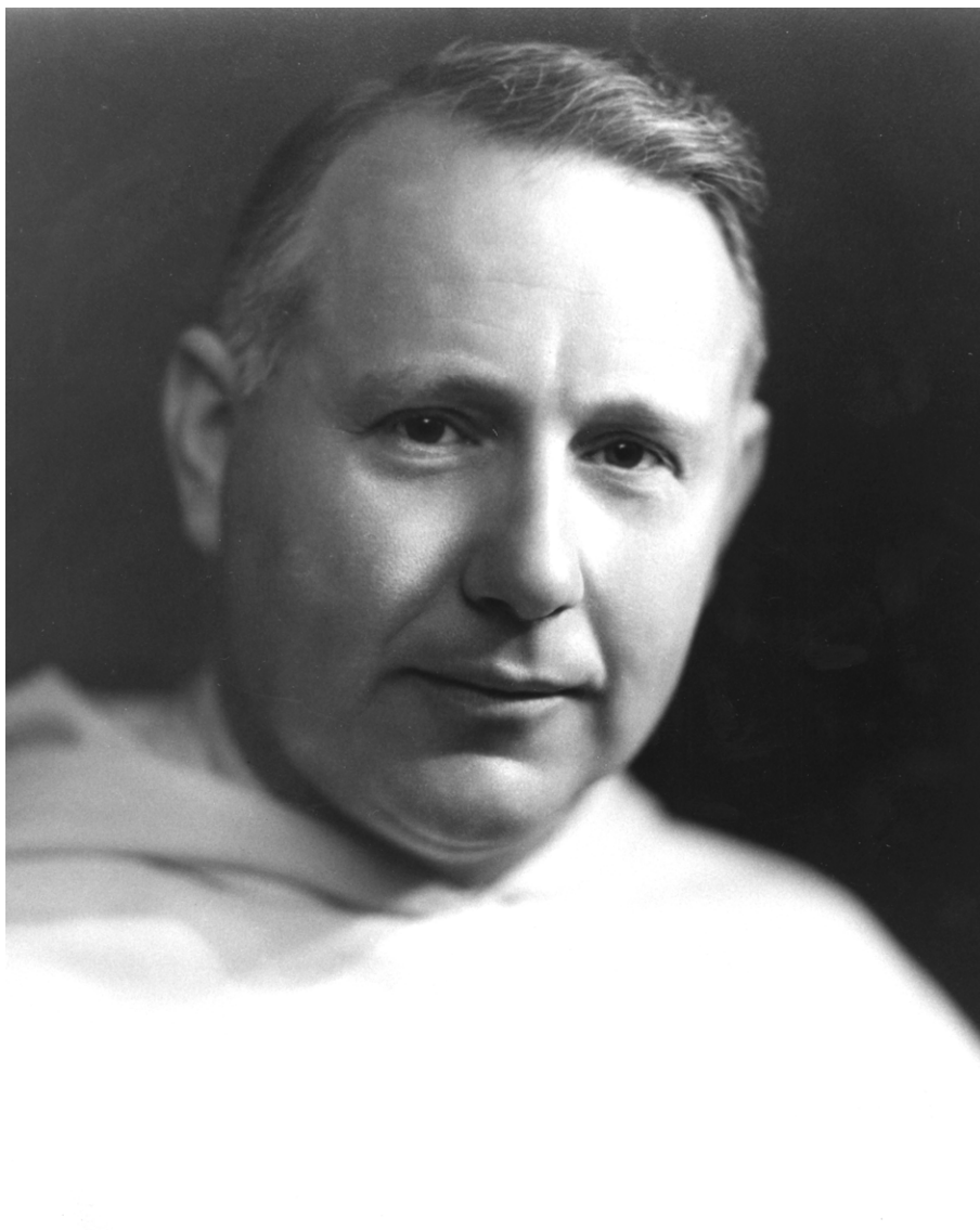
Georges-Henri Lévesque, o.p. (1903-2000).