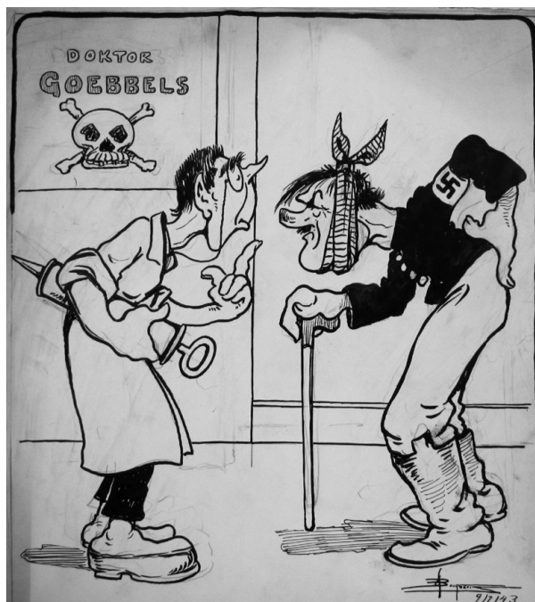
Sauf vot' respect vot' Excellence a dû attraper quelque chose dans la région du "Rhin", « La clinique du docteur Goebbels », La Presse, 9 juillet 1943.