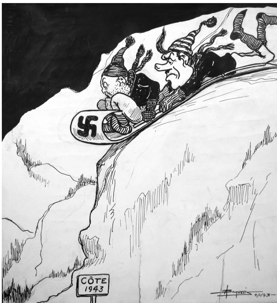
Toto : Tu m'avais promis qu'il n'y aurait pas de cahots, « Embourbés », La Presse , 27 janvier 1943.

Mais qu'en est-il de l'humour et de la caricature de Bourgeois lors de la Seconde Guerre mondiale? La caricature ou le dessin de presse durant les deux guerres mondiales peuvent paraître lourds lorsqu'ils sont utilisés dans un but essentiellement de propagande. Si humour il y a, sa portée s'estompe derrière le message politique et moralisateur cherchant à influencer le lecteur. L'équilibre entre ses différentes expressions n'est pas toujours atteint et c'est souvent le rire qui écope au bout du compte. Or, nous verrons que Bourgeois arrive à traiter du conflit sans verser dans le dessin de