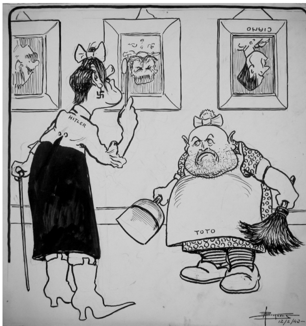
C'est-y au goût de madame, comme ça? « Grand barda au palais de Venise », La Presse, 12 février 1943.

En plus de les dépeindre en petites dames, Bourgeois les présente en tête à tête lors d'un souper amoureux, alors que la résistance, symbolisée par une bombe prête à exploser, menace leur moment intime.