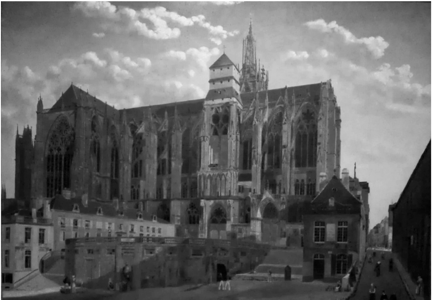
La cathédrale de Metz, telle qu'elle se présente à la naissance de Pierre-Henri Bouchy. Vue de la Cathédrale de Metz , huile sur toile, Gavard, 1826. (Musée de la Cour d'Or, Metz).