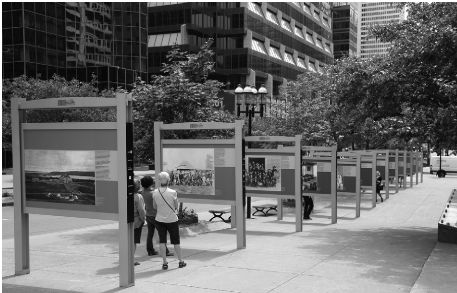
Vue de l'exposition Devoir de mémoire – Les pensionnats autochtones du Canada , depuis l'avenue du Président-Kennedy, à Montréal. Musée McCord.

cularités, ses différents plans et niveaux superposés, l'expérience émotive s'avère en quelque sorte un montage, un amalgame de sensations ou d'associations. En troisième lieu, les archives possèdent un dénominateur commun. Qu'elles nous rendent tristes ou qu'elles nous fassent rire, qu'elles nous émerveillent ou qu'elles nous rendent nostalgiques, les archives peuvent nous émouvoir parce qu'elles ont le pouvoir d'évoquer, autrement dit de rappeler les choses oubliées, de les rendre présentes à l'esprit. La valeur émotive découle ainsi du pouvoir, de la fonction d'évocation des documents d'archives. Un pouvoir dont la portée est tout aussi historique que métaphysique. Historique puisque ce lien avec l'histoire, ce « moment du patrimoine », comme le soulignait le Conseil des académies canadiennes dans un rapport sur les institutions de la mémoire collective au Canada en 2015, représente une « émotion puissante »