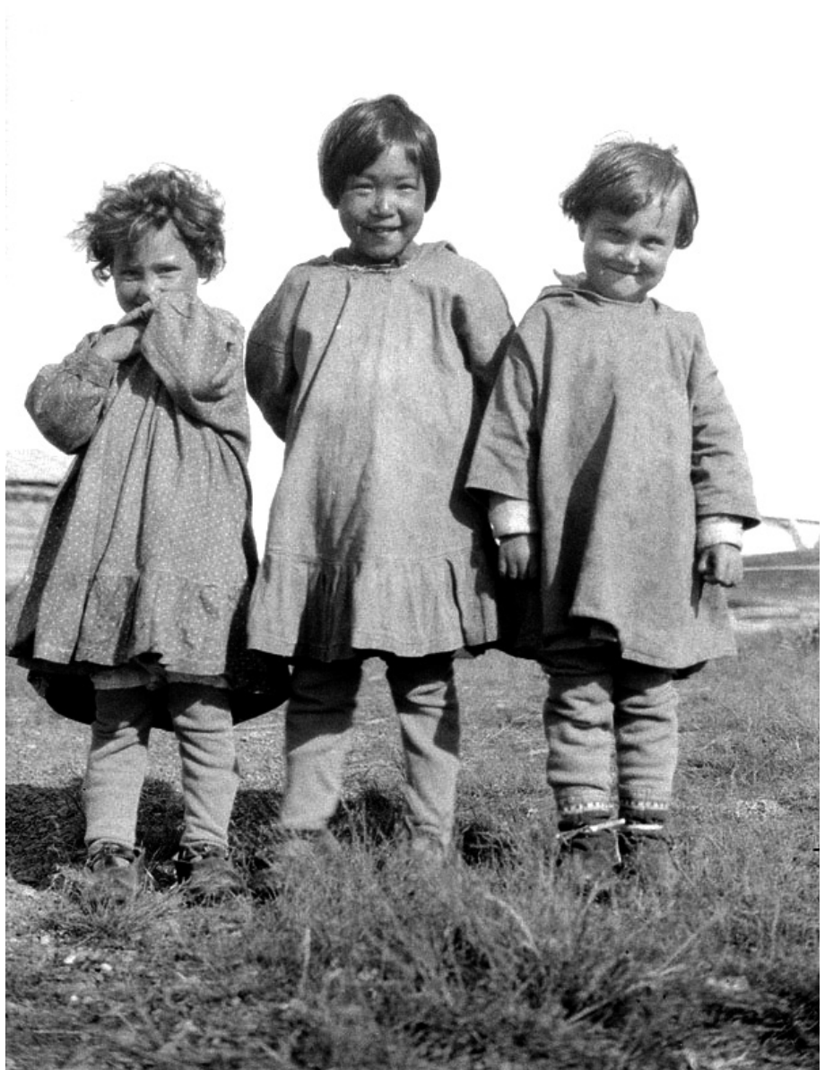
Deux enfants métis et une fillette inuite au pensionnat All Saints, Shingle Point, Yukon, vers 1930.

Nos travaux avec Marie-Pierre Boucher, Anne Klein et d'autres nous ont permis de dégager quatre caractéristiques. En premier lieu, les archives doivent être mises en contact avec des utilisateurs. L'émotion est la résultante d'une rencontre. Lorsqu'on y prête attention, la notion de rencontre est une composante tout à fait essentielle des archives. Le document d'archives le devient lors de la rencontre qui a lieu au moment de son exploitation. Une rencontre entre un utilisateur, ses connaissances, sa culture, son univers d'une part, et les archives, leur matérialité, leur contenu, leur contexte, d'autre part. La manifestation de l'émotion n'est pas le fruit d'une simple projection de l'utilisateur et elle n'est pas rendue possible uniquement par l'information contenue dans les documents d'archives. Comme le souligne Jean-Pierre Preud'Homme, différents « vecteurs d'émotion » tels la sensibilité, la valeur affective, l'état psychologique et l'âge vont jouer un rôle fondamental dans cette expérience,