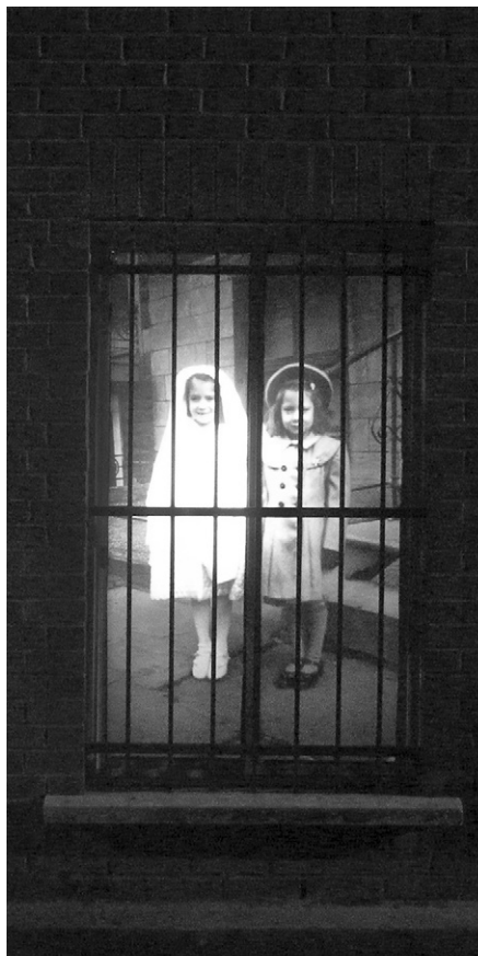
Loren Williams, 3669A, ruelle Saint-André / de Mentana (Le soir / At Night). Laterna magica , installation in situ , 24 septembre au 10 octobre 2010, Montréal. http://www.lorenwilliams.com/x-fr-accueil.html .

L'exposition présentée à Montréal sur l'avenue McGill College en 2013 visait à rappeler le triste sort des d'enfants ayant grandi dans des pensionnats autochtones et à faire réfléchir quant à la mission de ces institutions qui visait à les déposséder de leur culture. Pour atteindre cet objectif, et faire ce « devoir de mémoire », l'exposition était organisée autour de 24 photographies en noir et blanc provenant de différents centres d'archives. Chacune des images reproduites en grand format sur les panneaux d'exposition était accompagnée d'informations relatives à son origine ainsi que d'une légende servant à établir les faits et surtout les méfaits de cette vaste