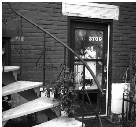
Loren Williams, 3709, rue Saint-André. Laterna magica , installation in situ , 24 septembre au 10 octobre 2010, Montréal. http://www.lorenwilliams.com/x-fr-accueil.html .

En raison de cette capacité d'évocation liée à leur caractère lacunaire se manifeste, selon Klein, l'une des plus belles qualités des archives : « elles sont porteuses d'une part de mystère toujours plus grande que ce qu'elles