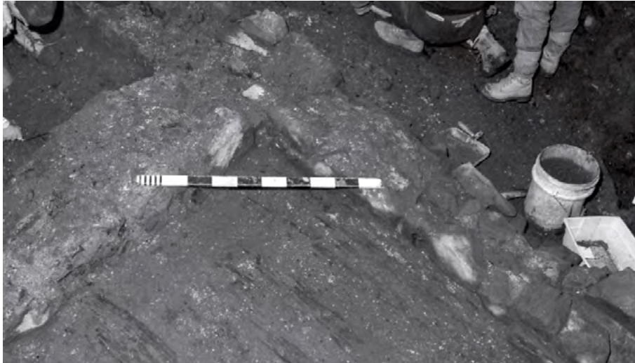
Vestiges de la maison Couillard, avec son plancher, retrouvés en 1991.

dans le stationnement du Séminaire, du côté de la rue des Remparts. C'est en effet dans le cadre d'une fouille de prospection que nous dirigions à proximité de l'Évêché, en 1993, que furent mis au jour des vestiges qui allaient s'avérer d'un grand intérêt.