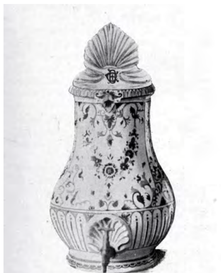
FONTAINE EMPORTÉE DE FRANCE PAR LOUIS HÉBERT, CONSERVÉE CHEZ LES SŒURS DU BON PASTEUR DE QUÉBEC.