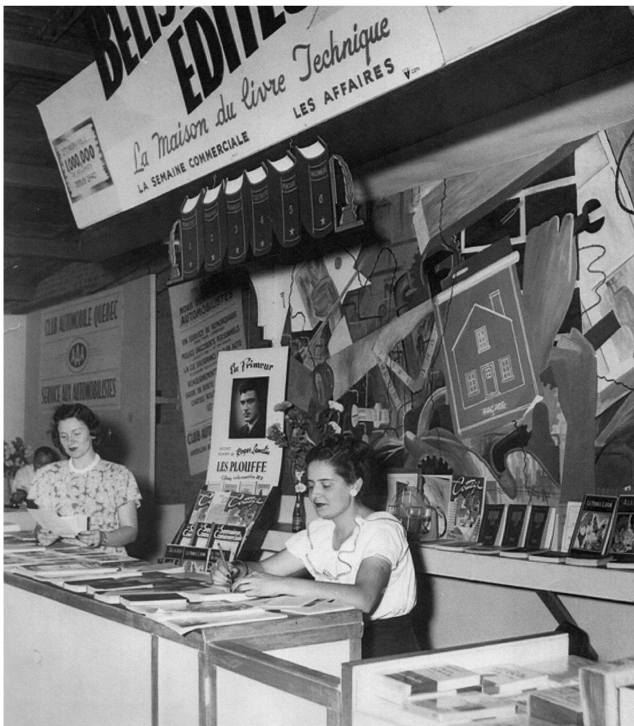
Le kiosque de Bélisle, éditeur, 1948. Photo : Studio Léo. E. Dery Reg'd. BAnQ, Centre d'archives de Québec, fonds Louis-Alexandre Bélisle. (P598, S44, D1, P80).

*Note : version remaniée d'un article à paraître dans Le Dictionnaire des gens du livre .