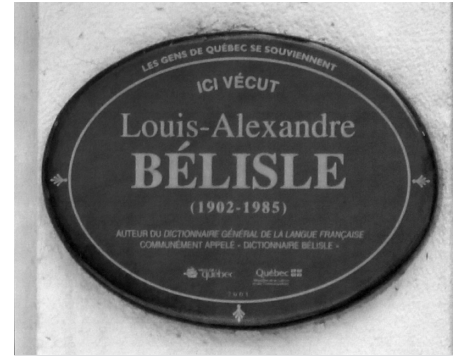
Épigraphie installée par la Ville de Québec au 801, avenue Murray. (La Cité-Limoilou) Québec.

reprise chez Beauchemin, puis aux Édition Aries. Une troisième édition grand format paraîtra en 1971, puis une dernière en 1979, chez Beauchemin. Le Dictionnaire rapportera à son auteur plusieurs honneurs : lauréat du Prix de la langue française de l'Académie française en 1958, puis de la médaille d'or