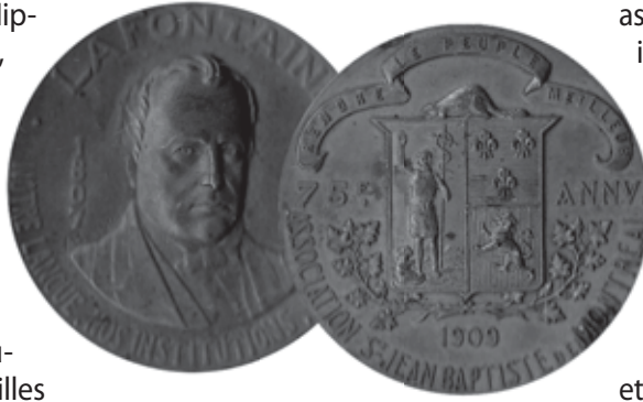
Avers et revers de la médaille Louis-Hippolyte La Fontaine de 1909.