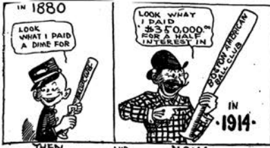
THEN AND NOW

Interest in National Pastime Crowds Out Early Fondness for Lacrosse of Man Recently Elected President of Boston Red Sox.