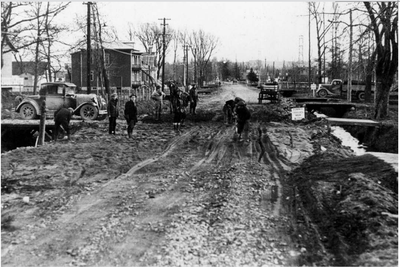
Route en construction, 1930-1939.

avec « modernisation ». Ainsi, du 20 au 25 juillet 1929, on inaugure officiellement la nouvelle « route du tour de la Gaspésie », allant de Sainte-Flavie à Sainte-Flavie : celle-ci fait 889 kilomètres.