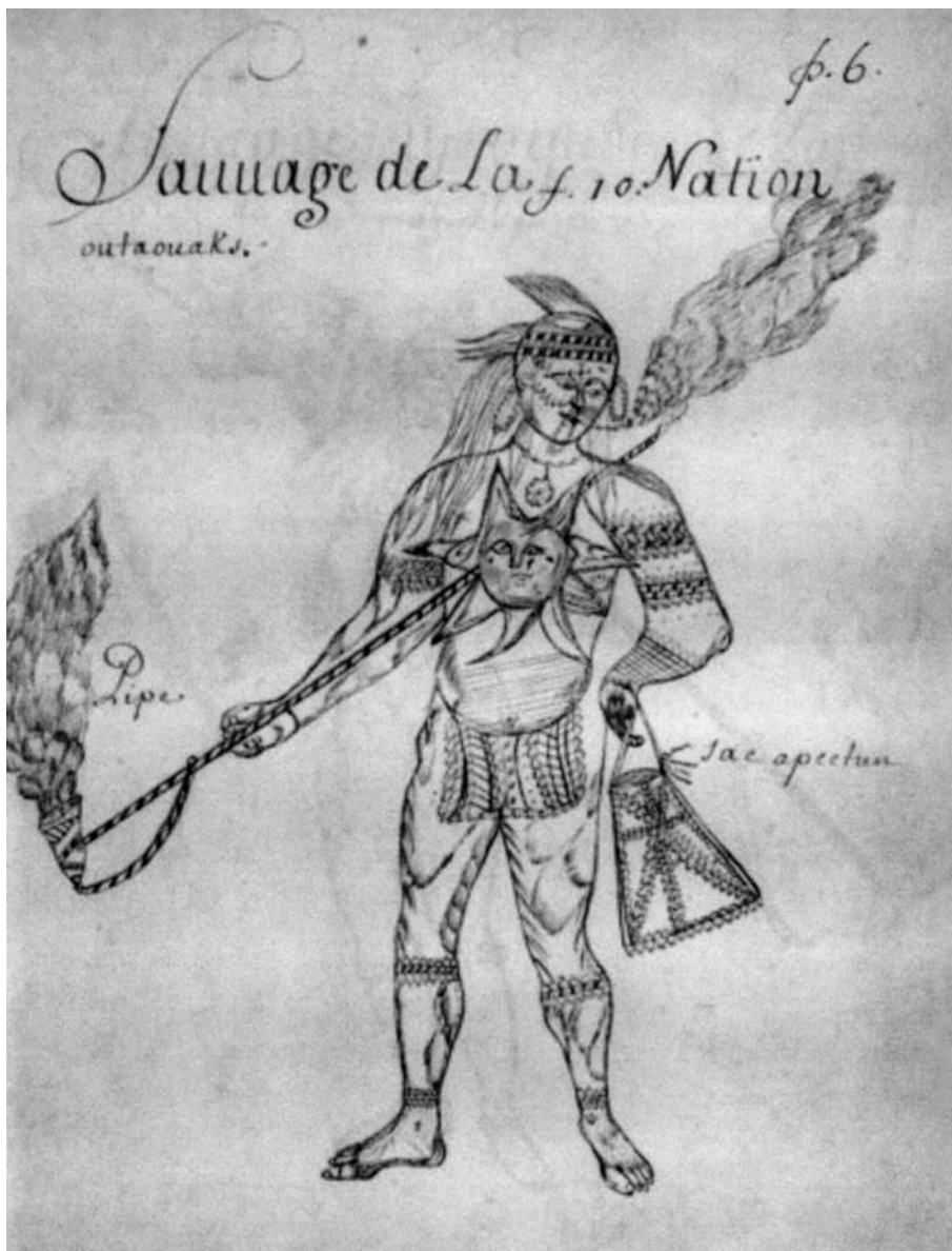
Raretés des Indes , « Sauvage de la nation outaouais », p. 6.

de dompter des ours à la résidence des pères à Sillery et avait formé le projet de montrer ces bêtes au roi à son retour en France! Quoi qu'il en soit, il avait un goût pour l'histoire naturelle et pour l'ethno-