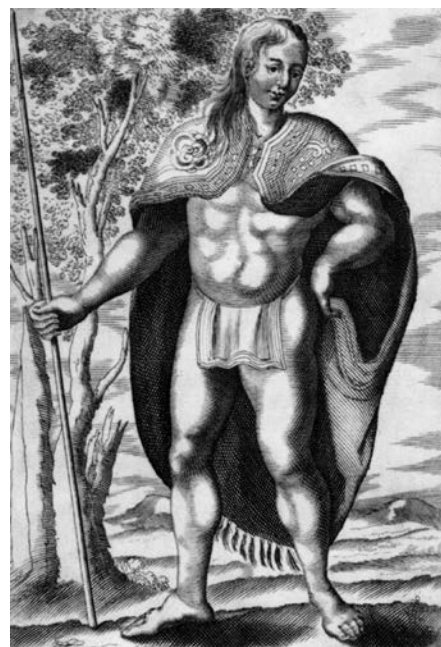
François Ducreux. Historiae Canadensis seu Novae Franciae libri decem. Paris, Mabre-Cramoisy, 1664 (planche IV).

À vrai dire, les « espèces sensibles » qu'il n'était peut-être pas arrivé à imprimer dans son esprit l'étaient dans les livres et spécialement dans un livre dont il nomme l'auteur tout en déclarant un peu hypocritement qu'il fait partie d'une liste de « trente écrivains dans lesquels je n'ai rien trouvé de ce que j'ai avancé » (folio 46). Cet auteur est le fameux naturaliste suisse Conrad Gessner (1516-1565), qui a écrit une Historia plantarum vers 1565 et une Historia animalium , publiée à Frankfort, de 1551 à 1587. On trouve en particulier dans ce dernier ouvrage, en quatre tomes, la source de la majorité de ses représentations de mammifères, d'oiseaux et de poissons. Quant à ses représentations d'« Indiens », elles prennent appui pour la plupart sur les mauvaises gravures d' Historiae canadensis seu Novae-Franciae Libri Decem du père François Du Creux (1596-1666), ouvrage publié à Paris chez Mabre-Cramoisy, en 1664.