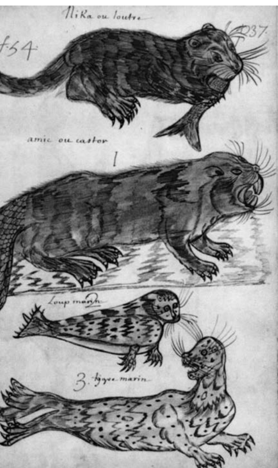
Raretés des Indes, animaux d'amphibie, folio 109, p.37. (Gilcrease Museum, Tulsa, Oklahoma, États-Unis).

On ne sait pas positivement s'il a été l'auteur des dessins du Codex canadensis . Les quelques rares schémas qu'il dessine dans son Histoire naturelle sont bien pauvres en comparaison avec les fines illustrations, parfois rehaussées de couleurs, du Codex . De toute façon, si ce n'est pas Louis Nicolas qui a fait les dessins du Codex , son auteur n'a pu que travailler sous sa direction ou sous son inspiration directe. Pour simplifier, nous parlerons donc de Louis Nicolas comme l'auteur des dessins du Codex . La question que nous aimerions soulever dans cet article touche les conditions concrètes de la production de ces dessins. Comment leur auteur avait-il procédé pour les faire? Avait-il observé la nature, fait des notations sur place, voire même s'était inspiré, au moins pour les oiseaux, comme John James Audubon l'avait fait deux siècles plus tard, de spé-