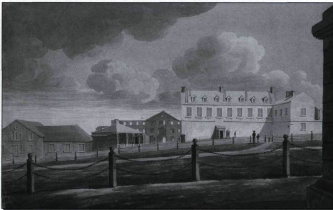
■ Vue des ruines du château Saint-Louis (à l'arrière-plan), après l'incendie de 1834. Le bastion situé à gauche du château Haldimand est un vestige de l'enceinte construite par Frontenac. Aquarelle de Charles Wright, vers 1837. (Bibliothèque et Archives Canada, C-131925).

C'est surtout son intérêt pour le théâtre que l'histoire a retenu. Si plusieurs pièces avaient été jouées dans la petite colonie, depuis la présentation, le 31 décembre 1646, du Cid de Jean Corneille dans la maison des Cent-Associés, le gouverneur Frontenac donne une nouvelle impulsion à ces spectacles montés au château Saint-Louis généralement durant le carnaval. Interrompus à la fin de son premier mandat, ces divertissements recommencent en 1689 quand il reprend du service au Canada. Outre les pièces de Corneille, on joue Jean Racine et Molière. Le théâtre, et en particulier la comédie, n'est cependant pas très apprécié par le clergé. La rumeur voulant que le Tartuffe de Molière, une satire qui s'attaque précisément aux dévots, soit interprété vaut au gouverneur de nouveaux démêlés avec l'évêque et les conseillers, en 1694. À la suite