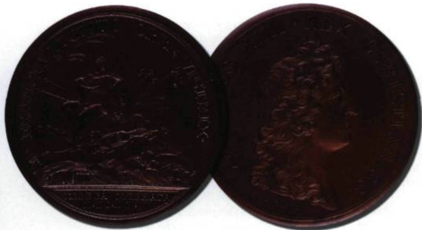
■ Médaillon Kebeca liberata frappée pour commémorer la victoire française au siège de Québec, en 1690. (Collection Yves Beauregard).

d'un mandement de Jean-Baptiste de La Croix de Chevrières de Saint-Vallier, il faudra attendre le Régime anglais pour voir à nouveau du théâtre à Québec.