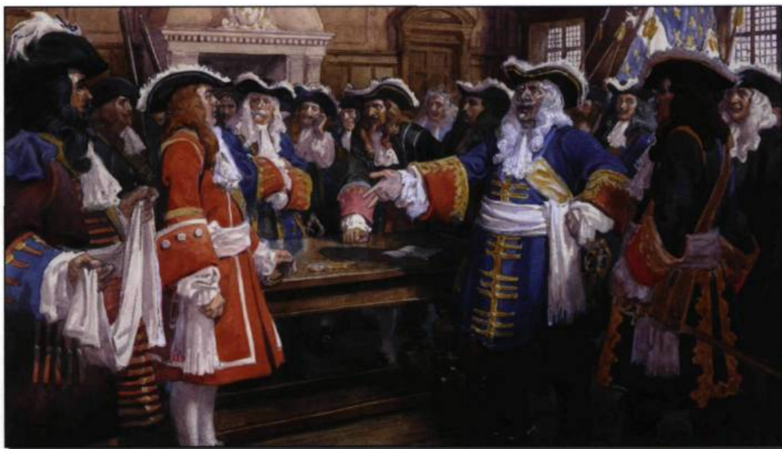
■ Frontenac recevant l'envoyé de sir William Phips venu demander la reddition de la ville, 1690. Aquarelle anonyme, vers 1925.

Québec n'est certes pas Versailles, mais l'intendant Jacques De Meulles avoue, en 1685, qu'on y vit aussi bien qu'en France. Le gouverneur Frontenac, qui a connu le faste de la cour de Louis XIV – que son épouse n'a d'ailleurs pu se résigner à abandonner –, donne en quelque sorte le ton à la bonne société québécoise. Bourg de marchands, d'artisans et de journaliers, en 1672, la capitale compte, à la fin du XVII e siècle, de plus en plus de gentilshommes gravitant autour du pouvoir, incarné par le gouverneur. Cette élite anime la vie sociale de la ville.