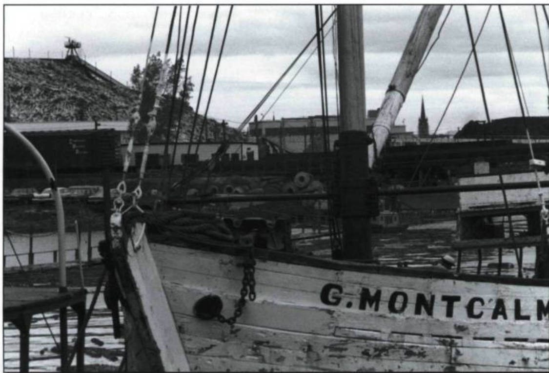
■ Une goélette nommée G. Montcalm , probablement construite au milieu des années 1950, filmée au quai de l'île aux Coudres, en 1966. Les goélettes de bois semblaient plus fragiles que les nouvelles embarcations de métal. Dans un parfait exemple d'intégration, les arbres des forêts québécoises servaient à la construction des goélettes qui assuraient une partie du transport maritime sur le fleuve Saint-Laurent. Photogramme tiré du documentaire Les Voitures d'eau (1968) de Pierre Perrault. (Photothèque de l'Office national du film du Canada).

que son insatiable fascination pour le fleuve Saint-Laurent, en tant que voie de navigation mais aussi symbole unificateur, quasi mythique, de nos origines, de nos appartenances et de notre spécificité : «Je suis de plus en plus envoûté par le fleuve. Je sens que le fleuve a quelque chose à me dire. C'est peut-être mon principal personnage. Il ne parle pas beaucoup, mais il me répond par les hommes, par leurs actions, avec le langage qui convient.» (propos tenus dans la vidéo Pierre Perrault parle de l'Île-aux-Coudres , 1999).