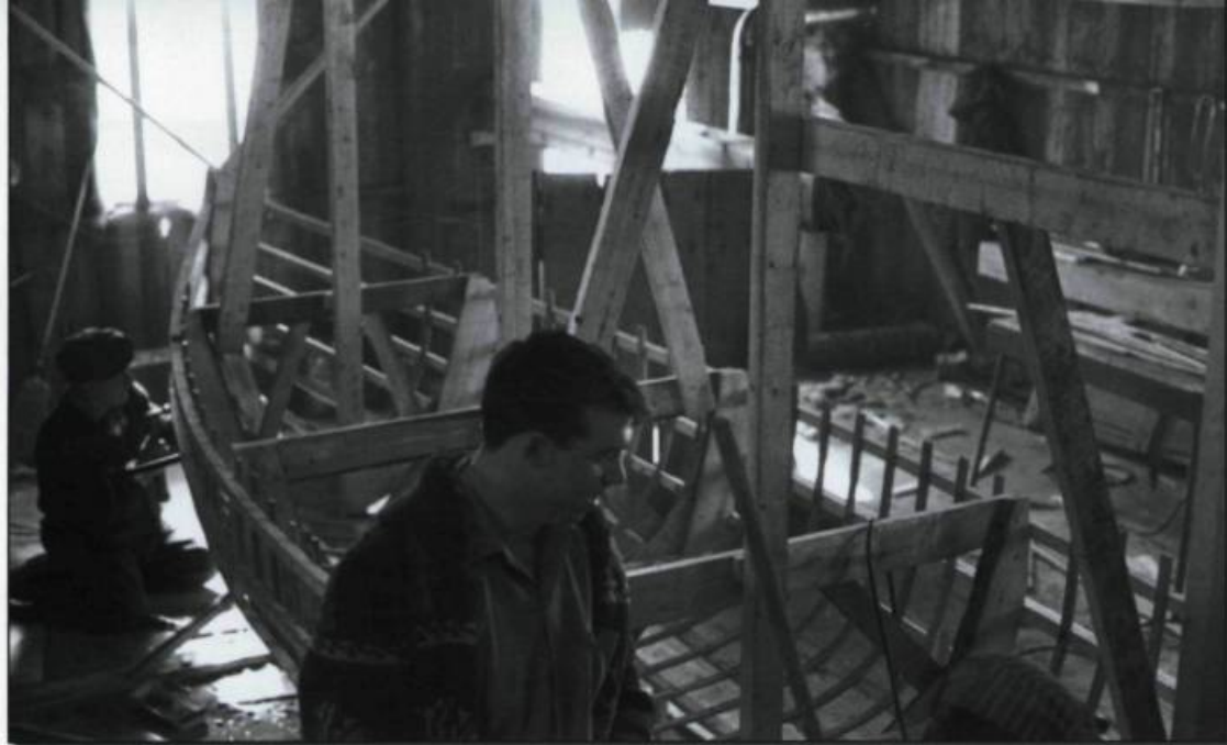
■ Dans l'atelier de construction des goélettes, à l'île aux Coudres, en 1965. La part d'intuition pour construire une goélette était considérable, mais rien n'était totalement improvisé; toutes les mesures et tous les choix à la base déterminaient les dimensions et la portée finale du produit. Photogramme tiré du documentaire Les Voitures d'eau (1968) de Pierre Perrault.

Allure (1986). Ici, Perrault veut partager et faire revivre l'émerveillement de Jacques Cartier, navigateur et découvreur, lors de sa découverte de la Nouvelle-France. Par ce voyage initiatique, porté par les vents et selon le même itinéraire, le film de Perrault veut nous faire découvrir les limites de ce pays que nous ne connaissons pas, qui semble n'être qu'un espace interminable entre quelques villes, dans ces régions que Cartier avait nommées «Terre de Caïn», «Toutes Isles». Dans La Grande Allure , Perrault parcourt les régions de Blanc-Sablon, Harrington Harbour, Tête-à-la-Baleine, qu'il avait déjà visitées lors de ses tournages antérieurs. Auparavant, dans le moyen métrage Les Voiles bas et en travers (1982), Perrault explorait la ville de Saint-Malo, en France, afin de sentir la présence, mais surtout constater l'oubli, ou du moins l'indifférence de certains Français face au personnage de Jacques Cartier. (Voir ces deux documentaires dans le coffret de l'ONF intitulé Le Fleuve ).