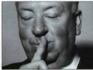
«Hitchcock et l'art : fatales coïncidences»

Jusqu'au 15 octobre 2000. «De Renoir à Picasso» Chefs-d'œuvre du musée de l'Orangerie à Paris Du 16 novembre 2000 au 18 mars 2001.