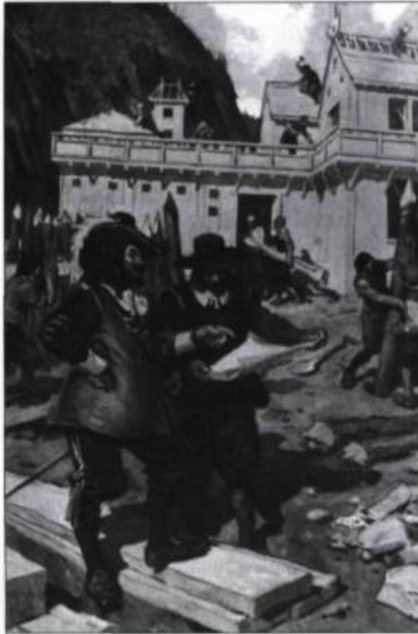
Samuel de Champlain dirigeant la construction de son «abitation», à Québec, en 1608. D'après une peinture de C.W. Jefferys, 1910. (Collection Yves Beauregard).

À droite : Armes royales. Sculpture de Pierre Noël Levasseur, 1727. Photographie Patrick Altman. (Musée du Québec).