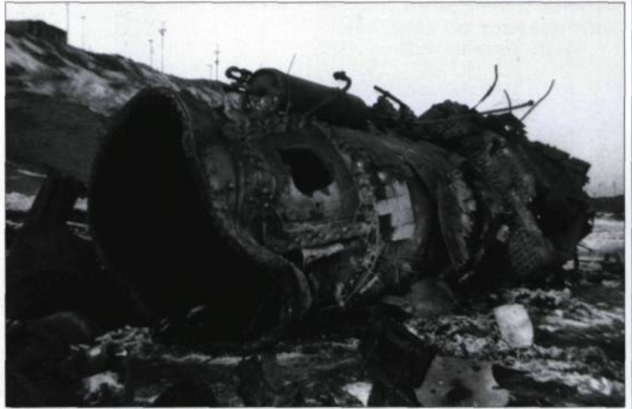
La chaudière retombée 100 pieds plus loin.

Cette locomotive du Delaware & Hudson vient de connaître une fin qui attend toute machine dont la chaudière est défectueuse. Dans une telle chaudière, 60 livres de pression équivalent à un kilo d'explosif. Tant que les parois sont en bon état, aucun problème. La chaudière qui pèse plus de 100 tonnes a été projetée à plus de 100 pieds. L'équipe de conduite a été décapitée par l'explosion. On notera que le tender a survécu, ainsi que le châssis de la locomotive. C'est pour servir de tampon que, dès les débuts du chemin de fer, on place une voiture à bagage entre la locomotive et la première voiture passager.