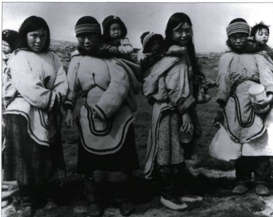
«En revenant du marché». Photographie du frère André Chauvel, vers 1950 à Maricourt. (Collection Chauvel, n° 73. Archives du Musée de la civilisation, Québec).

Michel Brochu se remémore également qu'il fallait compter de deux à trois semaines avant que les œuvres n'arrivent après qu'il en ait fait la demande. Dès réception, elles étaient payées «rubis sur l'ongle». En outre, les prix à l'époque pouvaient varier entre 3 $ et 12 $ par pièce, même si quelques œuvres en provenance de Puvirnituk furent payées jusqu'à 40 $. Toutefois, on doit considérer qu'en moyenne, il était versé de 7 $ à 10 $ pour chaque œuvre.