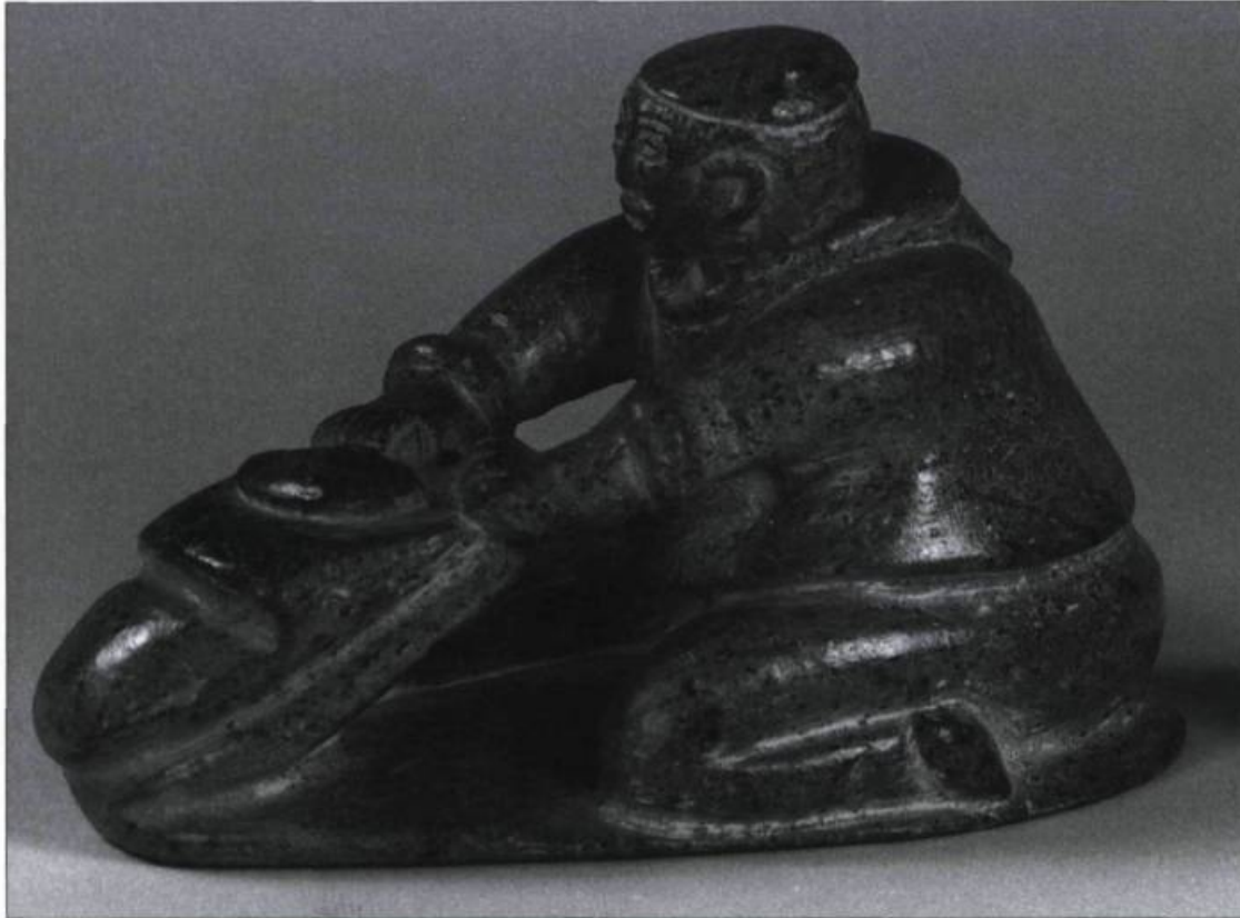
Inuit à genoux, assis sur les talons, dégraissant une peau avec un couteau à lame semi-cylindrique. Sculpture en ronde-bosse sur stéatite par l'artiste Nayumi de Kangiqsujuaq. (Musée de la civilisation, Québec).

Pour atteindre cet objectif, Michel Brochu avait conçu le projet qu'il fallait réaliser «une photographie de la situation de la sculpture esquimaude en 1964 et 1965 et des objets d'usage courant utilisés toujours par les mêmes Esquimaux, à Maricourt (Kangiqsujuaq).» (Brochu, 24 mars 1994). Disposant de moyens financiers limités et convaincu du peu de différences à travers la culture matérielle de tous les Inuits du Nouveau-Québec, un village comme celui de