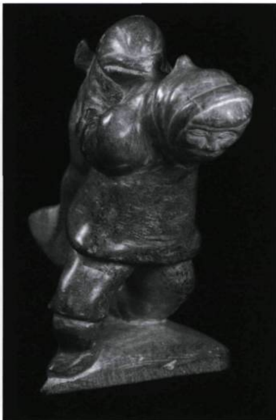
Un Inuit portant un phoque sur son dos. Sculpture en ronde-bosse sur stéatite de l'artiste Yanis de Kangiqsujuaq. (Musée de la civilisation, Québec).

mes, dans le cadre de l'Exposition universelle de 1967. L'événement regroupait une vingtaine d'œuvres : « [...] parmi, évidemment, les plus belles de tous les postes du Nouveau-Québec et également de l'archipel de la Trinité (îles Belcher) ». (Brochu, 25 octobre 1994).