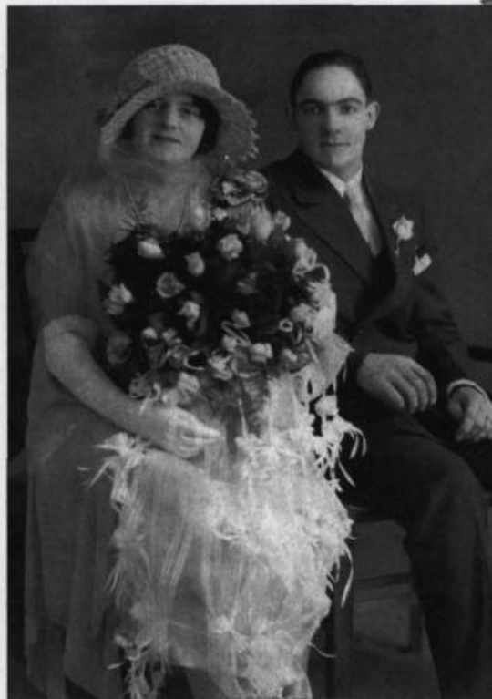
Le mariage consacre l'union d'un homme et d'une femme et les célébrations de la journée des nocces sont exécutées dans le but d'officialiser cette alliance aux yeux de tous. Mariage Tessier-Bellerose, vers 1930. (Collection Yves Beauregard).

manifeste, mais plutôt une participation permettant, d'une part, de souligner la séparation de jeunes adultes quittant le groupe des célibataires et, d'autre part de retarder le moment de l'accomplissement de l'acte sexuel. C'est la signification des tours joués aux nouveaux mariés. À partir des années 1920, du moins dans les milieux urbains, la nuit de nocces était vécue habituellement dans un lieu neutre, à l'abri des indiscrets.