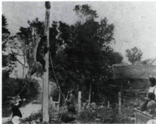
«Grimpez Martin!». («Album universel», 13 janvier 1906).

Joseph-Édouard Guilbault, du célèbre jardin portant son nom, s'applique beaucoup à développer les talents du pays. De 1842 à 1870, ce véritable Barnum forme des trapézistes, des funambules, des contorsionnistes, des jongleurs, des pantomimes à ce point virtuoses qu'on les retrouve dans des troupes qui parcourent le globe. La