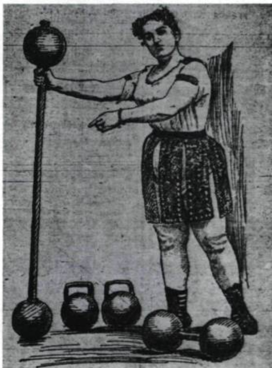
Le culte des femmes fortes. («La Patrie», 2 novembre 1899).