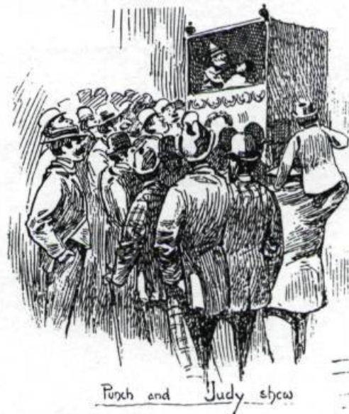
Le montreur de marionnettes. («Dominion Illustrated», 26 septembre 1891).