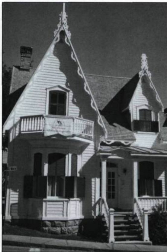
La maison Desjardins à Lévis est devenue un centre d'interprétation de l'histoire ouvert au grand public. (Archives de la Société historique Alphonse-Desjardins).

vement Desjardins (1900-1920), la parution de nombreux articles, notamment dans La Revue Desjardins qui consacre une de ses chroniques à l'histoire, ainsi que la rédaction d'un Guide pour la mise en valeur de l'histoire des caisses Desjardins , qui sera bientôt offert aux caisses.