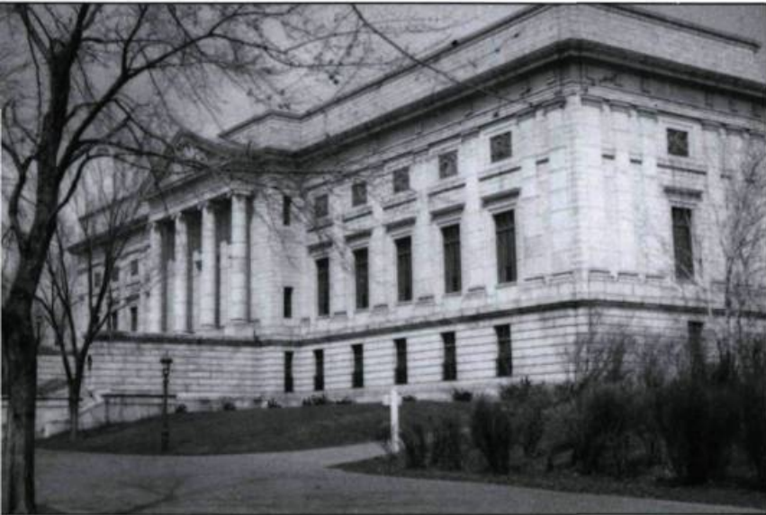
De 1931 à 1979, les archives nationales étaient logées dans l'édifice du Musée du Québec. (Photographie de Léopauld Arcand. Archives nationales du Québec à Québec).

chives, publication de textes anciens et d'inventaires, mais aussi transcription de documents conservés à l'étranger. Dès le début du siècle, Joseph-François Perrault complète une première classification des archives. De même Georges-Barthélemi Faribault entreprend-il un nouvel inventaire en 1845 dans les voûtes de l'ancien palais épiscopal à Québec. Ces divers travaux allaient pourtant être perturbés d'abord par le déménagement à Montréal, en 1847, de nombreux registres – la législature s'y était établie en 1841 pour revenir à Québec en 1851 à la suite de l'incendie du Parlement provoqué par une