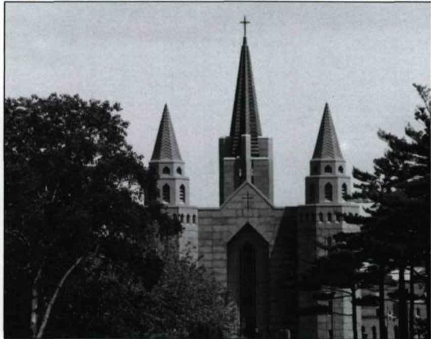
La chapelle du Grand-Séminaire devenue Pavillon Casault où logent les Archives nationales du Québec à Québec depuis 1980. (Photographie de Daniel Lessard. Ministère des Communications du Québec).

Archives gouvernementales, archives judiciaires, archives privées, archives notariales, registres de l'état civil, archives photographiques