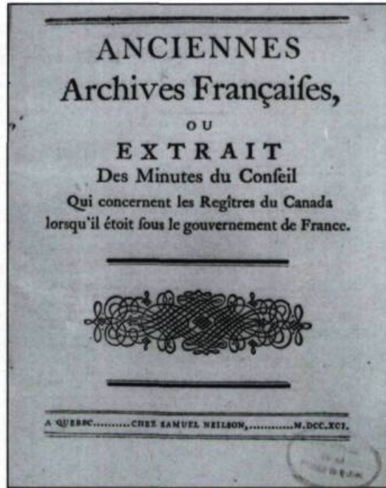
Page couverture du Rapport Dorchester . (Samuel Neilson, éditeur.).

Rappelons enfin que la publication de ce rapport et des recommandations qu'il contient marque aussi une évolution du concept même d'archives. D'abord «titres de tous les particuliers» nécessaires à la sécurité publique, Hocquart déplore leur dispersion dans les maisons particulières, plus sujettes aux dangers du feu. Peu après, on ne s'intéresse qu'à la conservation des archives qui peuvent faciliter la gouverne du pays. Avec le Rapport Dorchester une autre préoccupation surgit, celle de leur arrangement