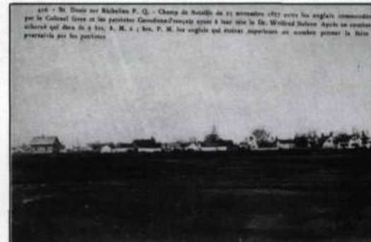
Site de la «victoire de Saint-Denis». Carte postale éditée par Pinsonneault Frères, faisant partie d'une série portant sur les événements de 1837. (Coll. de l'auteur).

Le 7 mai 1837, il est le principal orateur à Saint-Ours, lors de la première des 50 assemblées de protestation que les Patriotes organisent dans tout le Bas-Canada. Le 23 octobre de cette même année, il préside la dernière et la plus importante de ces réunions, la célèbre Assemblée des Six Comtés, qui rassemble à Saint-Charles plus de 6 000 personnes. Le lendemain, il est à la tête du groupe qui rédige une «adresse au peuple du Canada» pour en