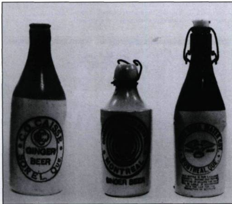
Différents modèles de bouteilles contenant de la bière de gingembre.