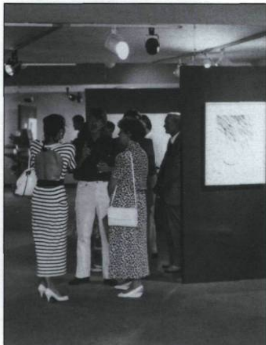
Depuis plusieurs années, Loto-Québec prête aux musées régionaux des œuvres de sa collection québécoise. Ce programme a permis au Centre culturel de Drummondville d'organiser en août 1988 une exposition d'œuvres d'artistes québécois.

Ces collections, répétons-le, encouragent surtout l'art contemporain, mais les artistes privilégiés pratiquent généralement une forme d'art bi-dimensionnelle et s'adonnent de préférence à