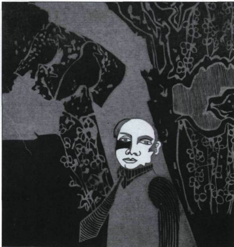
Monique Charbonneau. «L'oiseleur», gravure sur bois, 1969. (Collection Lavalin).

palement la lumière – entraînent une détérioration prématurée des pièces.