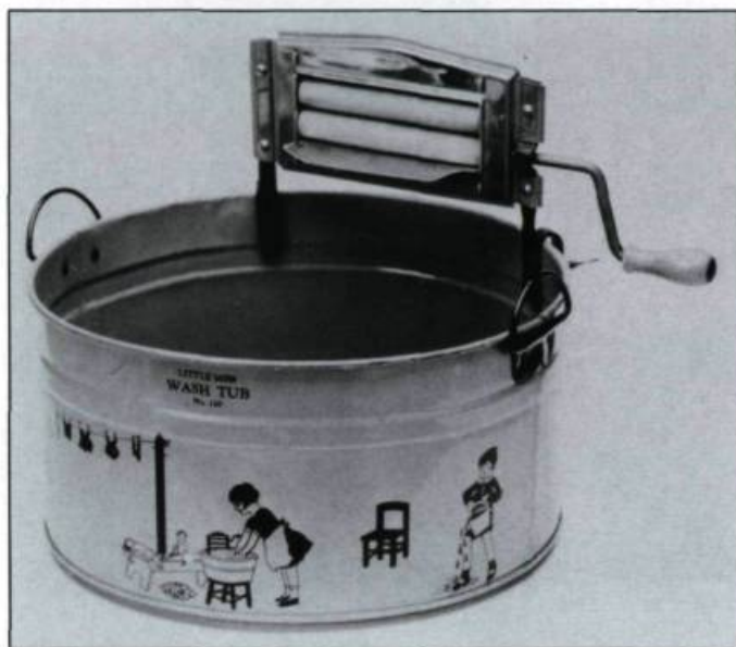
«Cuve à laver miniature». États-Unis, vers 1920. (Collection R. et F. Poulin, Québec).

Le houx et le gui sont introduits ici entre 1860 et 1870; des marchands montréalais, notamment, en offrent à leur clientèle. Ce feuillage permet de décorer les maisons, bourgeoises cela va sans dire, de la manière suivante: des guirlandes entrelacées de fleurs agrémentent les lustres, les