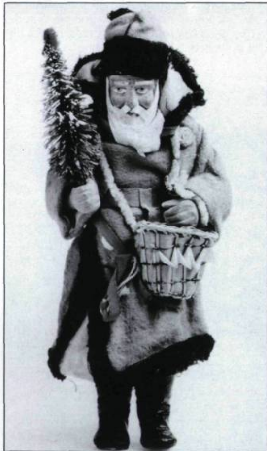
«Bonbonnière en forme de Père Noël» provenant de la région de Kamouraska, fin du XIX e siècle.

ou l'Enfant Jésus et, jusqu'au début du XX e siècle, Noël garde un caractère essentiellement religieux. La Noël à saveur commerciale met plus de temps à prendre racine chez les francophones. Au tournant du siècle, G.M. Fairchild, un observateur anglophone écrivait ceci au sujet de la population d'un petit village de la banlieue de Québec: