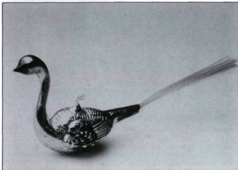
«Cygne de verre». Allemagne, fin XIX e siècle.

L'influence américaine aidant, le grand saint Nicolas perdra peu à peu ses attributs moralisateurs; à la place d'un fouet, c'est un sapin qu'il tiendra dans la main. Le donateur ne serait désormais que généreux. Santa Claus fait ainsi son entrée au Canada sous ces traits, l'imagerie locale lui faisant parfois même chausser une paire de raquettes. Toutefois, sa générosité touche d'abord les milieux aisés. Pour une grande partie de la population, le donateur reste saint Nicolas