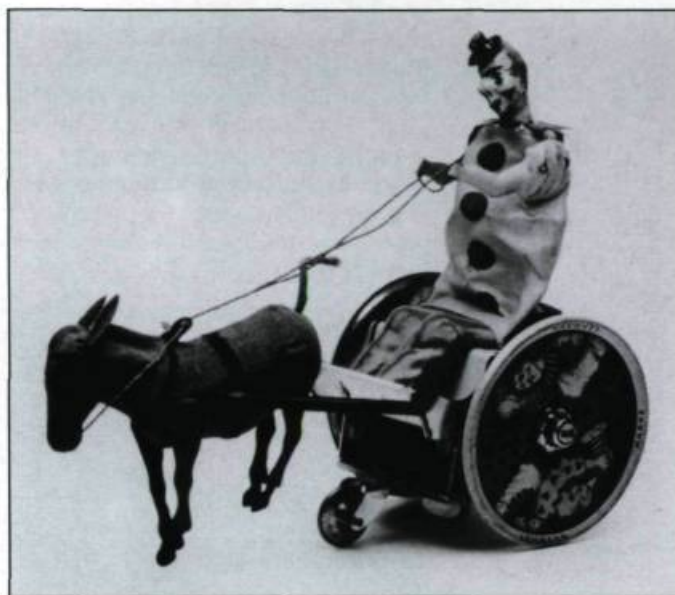
«La mule récalcitrante». Lehman, Allemagne, 1927. (Collection R. et F. Poulin, Québec).

entre 1850 et 1900. Jusque vers 1870-1880, le jour de l'An garde une certaine primauté: les cartes de souhaits, par exemple, sont acheminées en plus grand nombre pour le premier de l'An. Cette habitude vaut aussi pour le monde anglophone. Avec la pression commerciale, un nombre croissant de gens répondent à l'exigence de Santa Claus de distribuer les cadeaux à Noël, une partie du moins, quitte à garder l'autre part pour le jour de l'An.