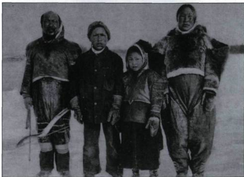
Certaines cultures savent mieux que d'autres se couvrir la tête et le haut du corps et ainsi diminuer la transpiration (qui glace l'épiderme lors de l'engel) tout en empêchant l'humidité de pénétrer dans les chaussures. (Carte postale, collection Simon Beauregard).

tropiques! Écoliers et travailleurs souhaitent alors la fermeture de leurs édifices. Parfois, la nouvelle s'étire plus longtemps que ne dure le phénomène. Pour utiles qu'elles peuvent être, les informations dramatisées révèlent une aversion — sinon une haine — de l'hiver et accroissent l'angoisse des personnes malades ou avancées en âge. En fait, toute la population se trouve ainsi soumise à une pression accentuée; ce genre de nouvelles constitue un stress additionnel.