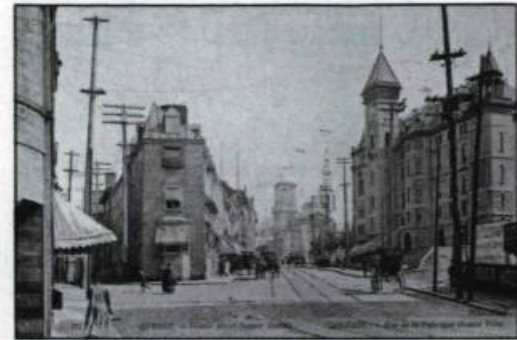
Un avant-goût des célèbres cartes postales du photographe Neurdein (N D phot.) qui seront présentées au Centre Vivre à Québec en 1990.

Présentée en collaboration avec la revue Cap-aux-Diamants , cette exposition mettra en valeur les œuvres photographiques (cartes postales) produites sur la ville de Québec par le photographe Neurdein de Paris, en 1907. Près de 80 œuvres ont été