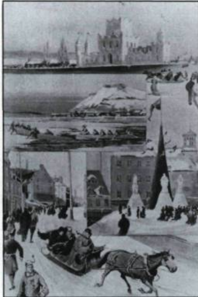
Scènes pittoresques du carnaval d'hiver de Québec en 1894 par l'artiste William H. Lawrence. (Archives de la ville de Québec, collection iconographique).

Du 21 janvier 1990 au 4 mars 1990. «D'un carnaval à l'autre»