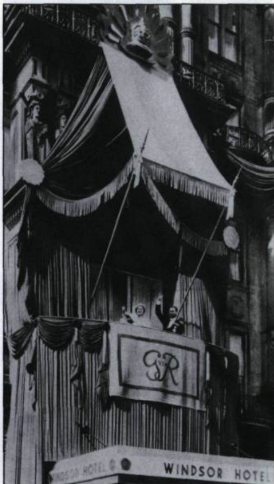
George VI et Elizabeth saluent la foule du balcon de l'hôtel Windsor à Montréal le 18 mai 1939.

Sur les voies du Canadien Pacifique, c'est la célèbre locomotive 2850 aux armes du roi qui