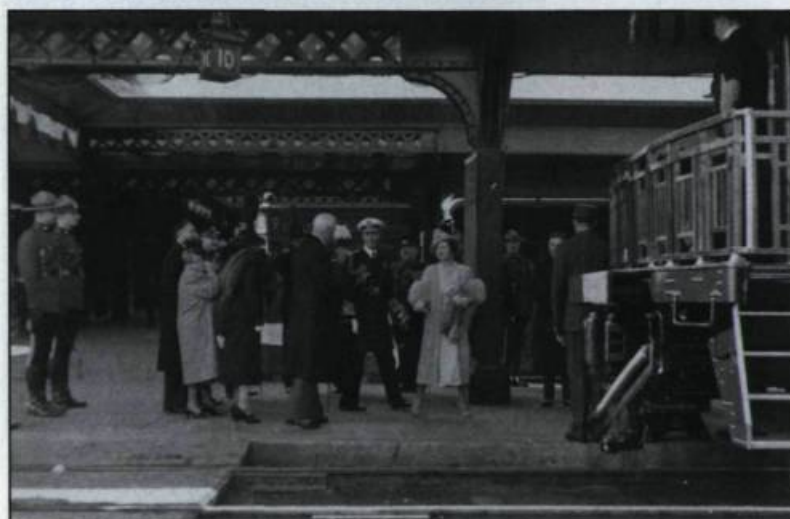
Le départ du couple royal de la gare Union de Québec après un bref séjour dans la vieille capitale.