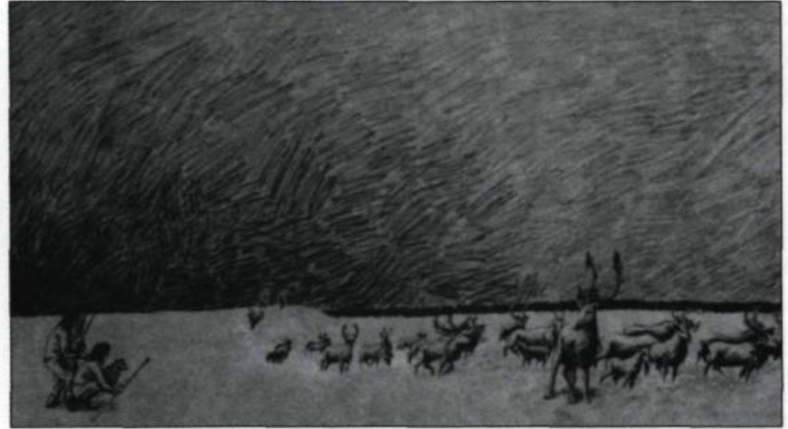
Cette illustration de Claire Fournier montre des chasseurs et un troupeau de caribous. (Villa Bagatelle).

Il y a 35 000 ans des humains d'origine asiatique traversent sur le territoire américain.