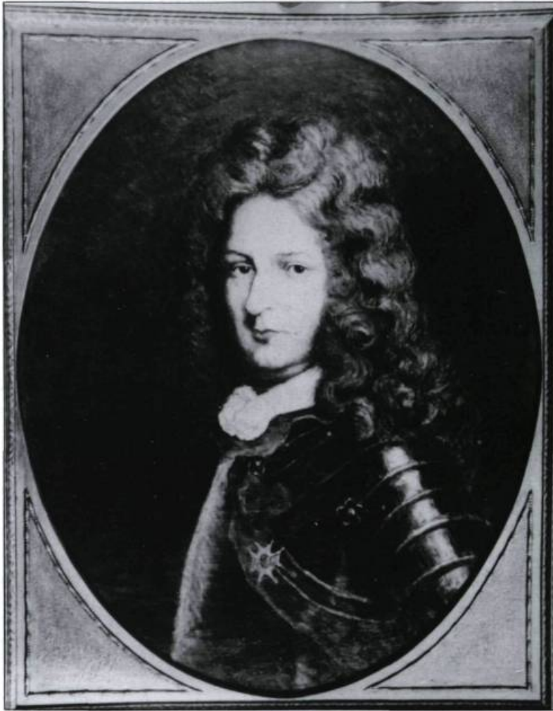
Pierre Le Moyne d'Iberville fut accusé par Jeanne-Geneviève Picoté de Belestre de l'avoir séduite et d'être le père de son enfant. Une ordonnance du Conseil Souverain de 1688 l'obligea à assurer la subsistance de l'enfant jusqu'à l'âge de 15 ans. (Archives nationales du Québec à Québec, collection initiale).

Toutes les jeunes filles n'ont pas droit à des dédommagements pour séduction. Seules celles