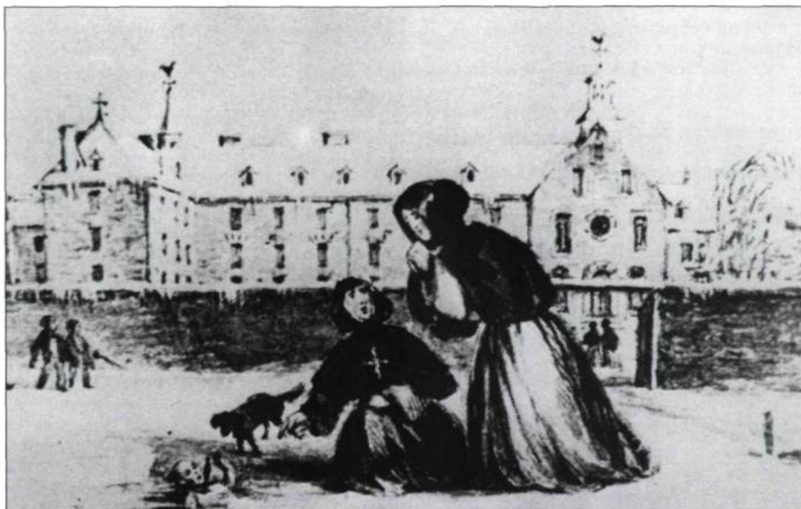
Après l'accouchement, certaines mères abandonnent leur enfant dans des endroits publics. Ce dessin anonyme montre des religieuses de l'Hôpital Général de Montréal recueillant un de ces enfants. (Ministère des Affaires culturelles).