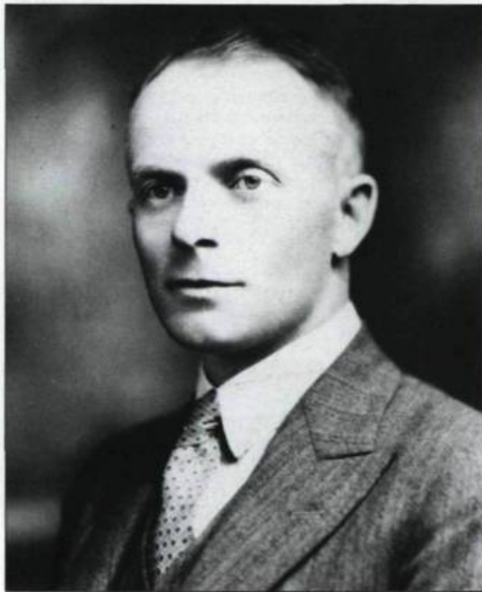
Adélar Godbout (1892-1956), agronome, professeur, et homme politique. Premier ministre de la province de Québec de 1939 à 1944, il présente lui même le «bill» accordant aux femmes le double droit de vote et d'éligibilité.

Adélar Godbout, qui a toujours voté contre le suffrage féminin, présente lui-même, en soutenant que les temps sont changés, le bill accordant aux femmes le double droit de vote et d'éligibilité.