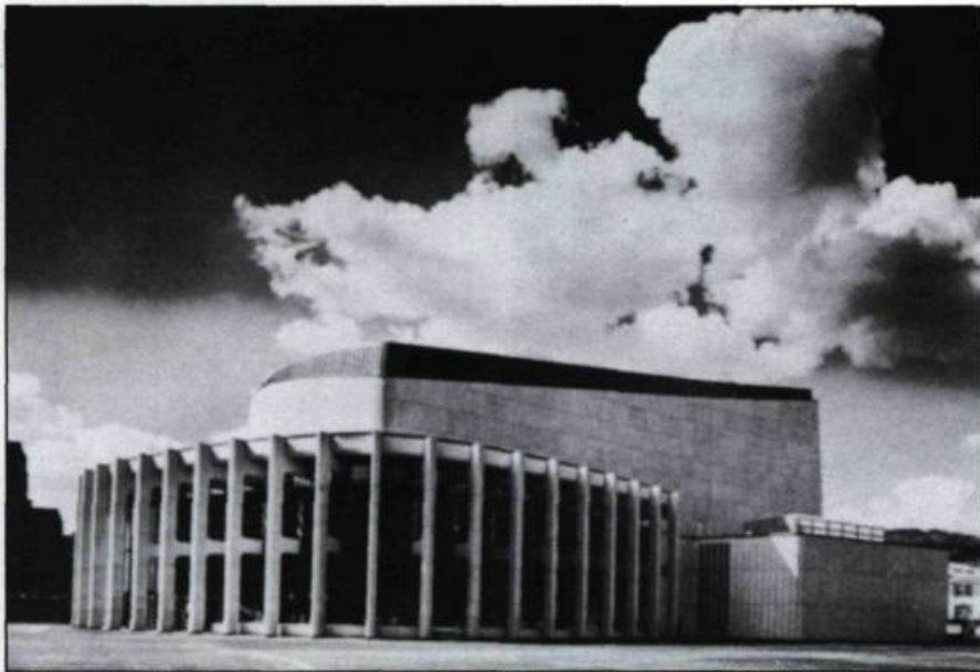
Inaugurée en septembre 1963, la salle de concert de la Place des Arts à Montréal sera un élément très important de la véritable révolution musicale que connaît la métropole. (Collection privée).

au plan technique, mais aussi dans la perception musicale. Les musiciens ont entendu de la grande musique et fréquenté des musiciens de calibre international.