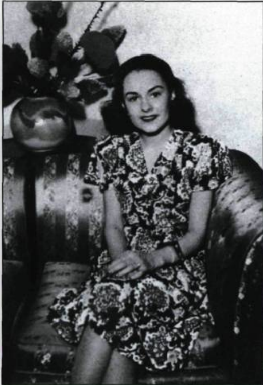
Claire Gagnier, une des plus grandes voix du Québec, effectue en 1947 une tournée en Amérique du Sud. Elle se produit par la suite sur plusieurs autres scènes internationales.

CAD – Donc, à l'école, vous avez acquis les rudiments de la musique comme tout le monde... Mais d'où origine votre passion pour les disques?