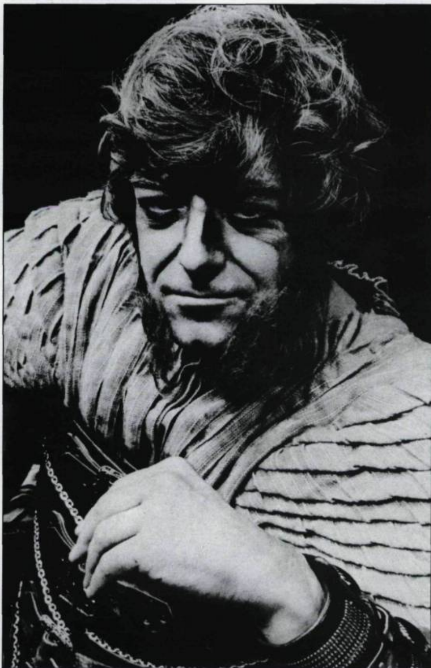
Le comédien Edgar Fruitier dans la pièce Lysistrata présentée au théâtre du Nouveau-Monde à Montréal en 1971.

ED – À l'école, j'avais des cours de solfège. À la fin de la semaine, pendant une demi-heure ou trois quarts d'heure, on retrouvait le do, le sol. J'avais probablement une prédisposition, car ces cours me passionnaient. Sur le piano, ma mère m'avait appris où trouver les notes. Évidemment, mes tantes, et surtout celle que je rencontrais plus fréquemment, ont cultivé ce goût. Quelquefois, elles me donnaient des conseils. Il fallait m'arracher au piano, je pouvais y rester des heures. À l'âge adulte, j'allais rencontrer une copine très bonne pianiste. On jouait du quatre mains. Je l'arrachais au repas, et on s'as-