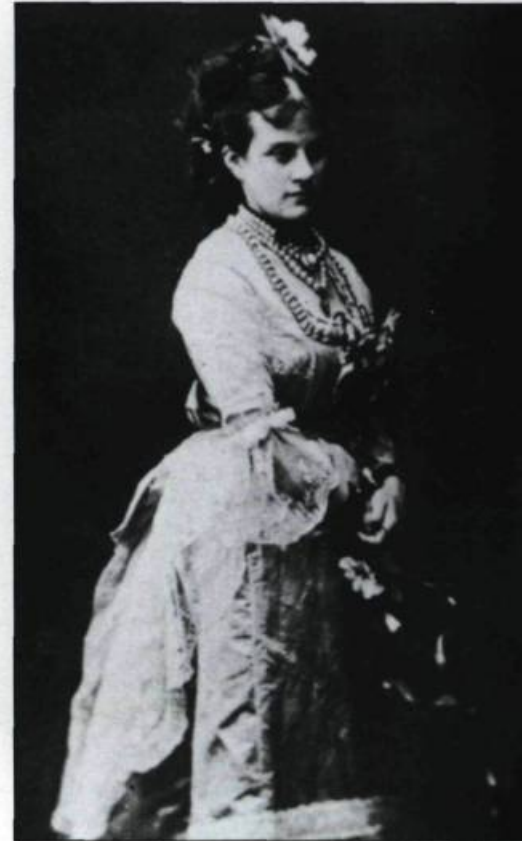
Née à Chambly, la Québécoise Emma Lajeunesse fait une carrière internationale sous le nom d'Albani. On l'aperçoit ici à ses débuts à Paris, en 1872.