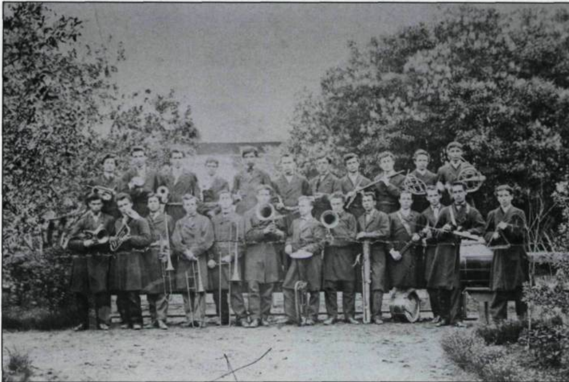
Le corps de musique du petit Séminaire de Québec en 1866-1867.

que. À Québec, ces fanfares constituent une attraction publique très recherchée. Les premiers concerts classiques commencent en 1770. Une série plus structurée voit le jour vers janvier 1782: les «Concerts de Québec» présentés tous les quinze jours, ce qui crée «un lien entre l'amateur, le professeur de musique, le musicien de fanfare et leur public enthousiaste». En ce XVIII e siècle, on exécute de jolies chansons à danser, d'amour et à boire, très animées et accompagnées au luth et au «clavessin».