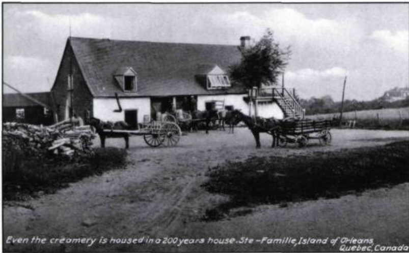
Even the creamery is housed in a 200 years house. Ste-Famille, Island of Orleans, Quebec, Canada

Au début du XX e siècle, l'île revient à l'agriculture, sa vocation première. Ancienne maison transformée en beurrerie à cette époque. (Carte postale, collection Yves Beauregard).