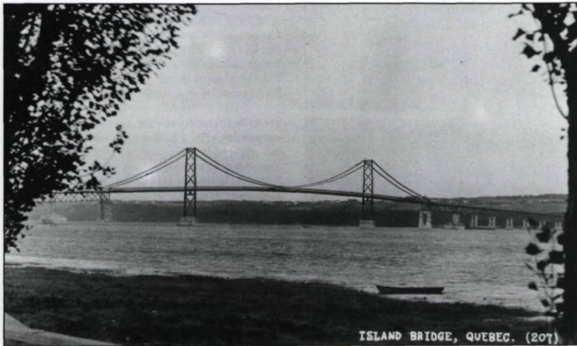
Le pont de l'île, inauguré le samedi 6 juillet 1935, fut construit grâce à la bienveillance de Louis-Alexandre Taschereau, premier ministre et député de Montmorency.