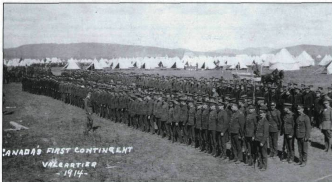
Vue générale du premier contingent de soldats formés à Valcartier.

Pour équiper une force à si court terme, Hughes avait dû embaucher plusieurs de ses amis comme agents acheteurs. La corruption et les irrégularités dans le cours de ces achats ébranlèrent le gouvernement Borden au cours des deux années suivantes. De nombreuses pièces d'équipement se révélèrent sans valeur. Les chaussures du Corps expéditionnaire allèrent plus tard se disloquer dans les boues de l'Angleterre et furent qualifiées, sarcastiquement de sham shoe . La pelle Mac Adam, conçue également pour servir de bouclier anti-balles aux soldats, se révéla inutile autant pour creuser que pour se protéger des balles. Il y avait finalement le fameux fusil Ross, fabriqué à Québec sous la pression de Hughes, qui faillit constamment à la tâche sur les champs de bataille. Le gouvernement britannique, au grand chagrin du Canada, dut remplacer tout cet équipement.